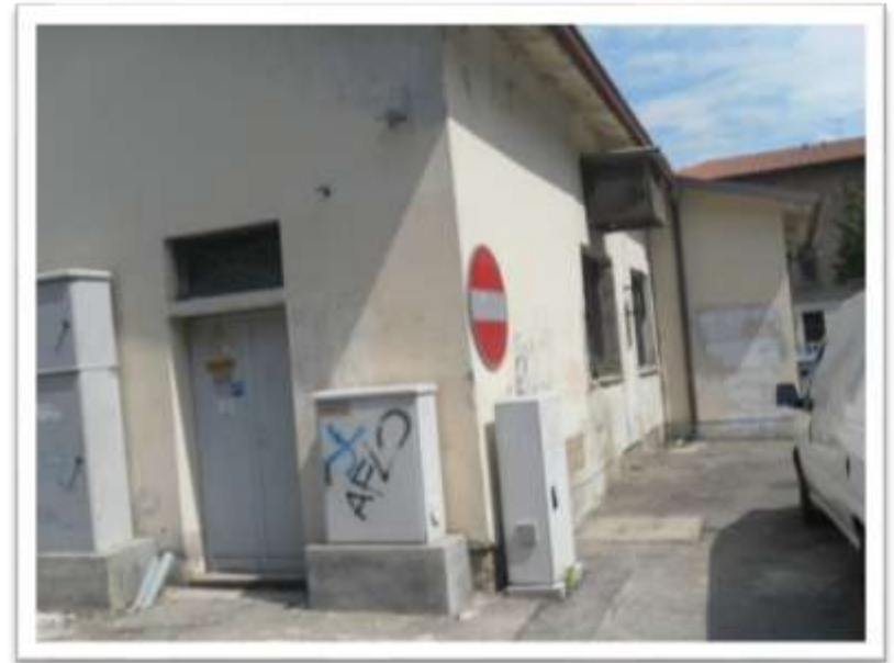
Archivio fotografico club 54 San Donà di Piave piazza Rizzo Il retro della pescheria prima della demolizione