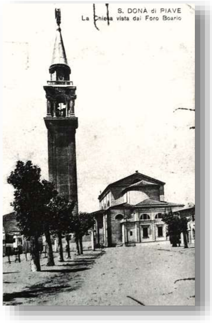
Il Foro Boario nel 1925 con il retro del duomo( Piazza A.Rizzo)