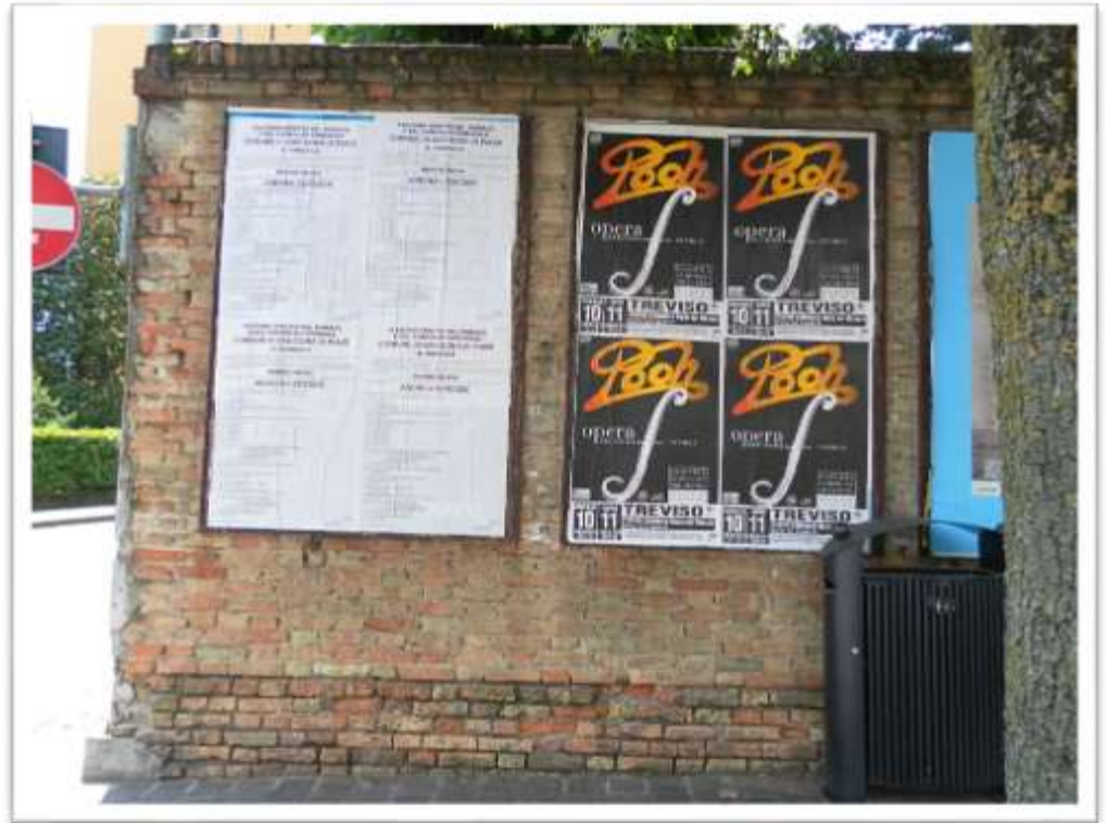
Archivio fotografico club 54 San Donà di Piave piazza Rizzo lato asilo S.Luigi altri particolari del muro di cinta