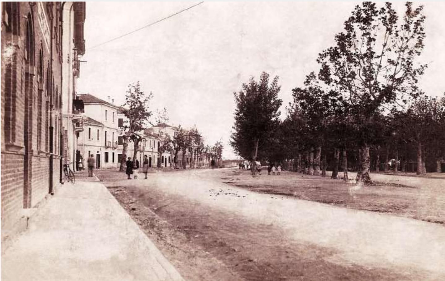
il foro boario lato sinistro com'era nel 1930