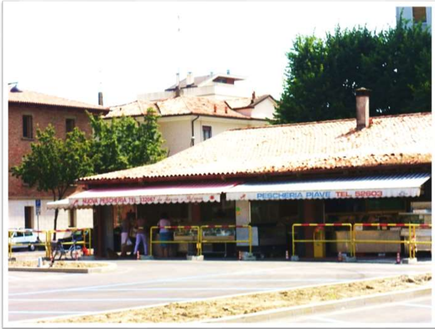
piazza Rizzo il fabbricato della pescheria poco prima della demolizione