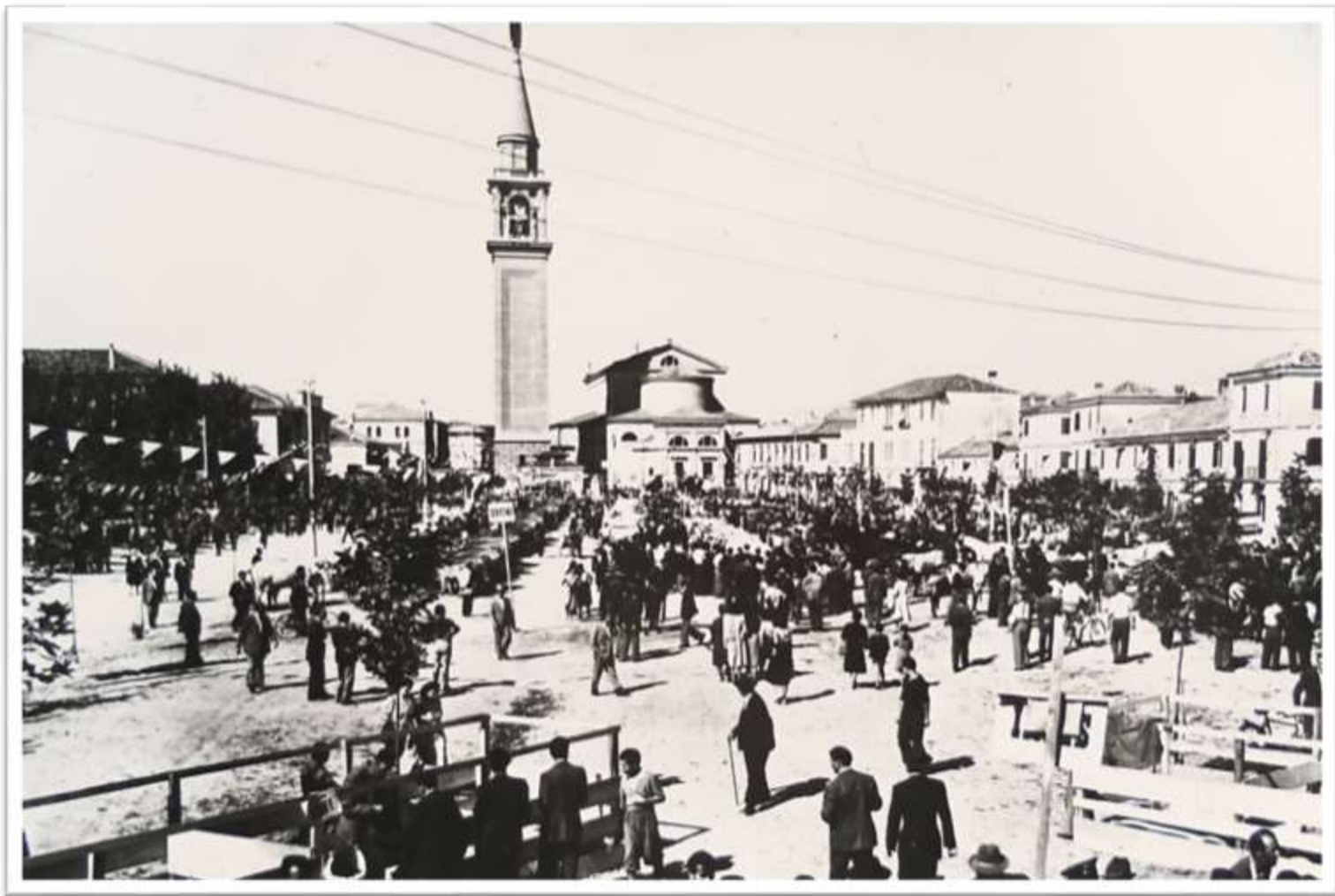
Il Foro Boario (ora Piazza Rizzo) fiera del bestiame ai primi del 1900