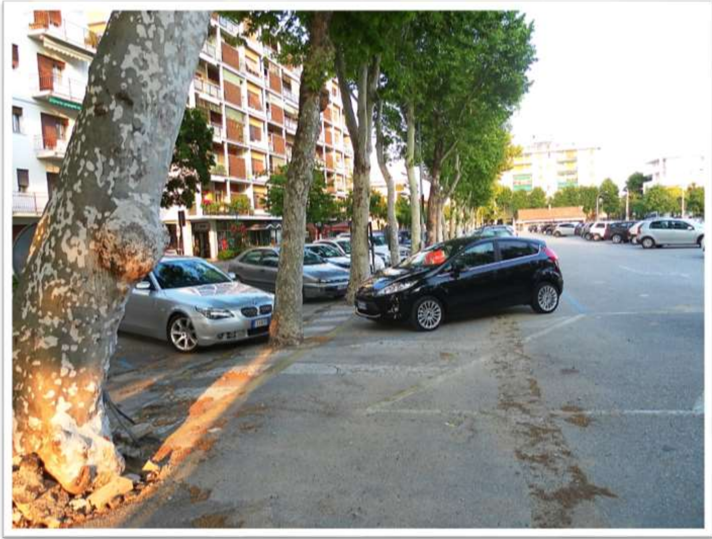
San Donà di Piave piazza Rizzo com'era prima della nuova ristrutturazione nel 2013