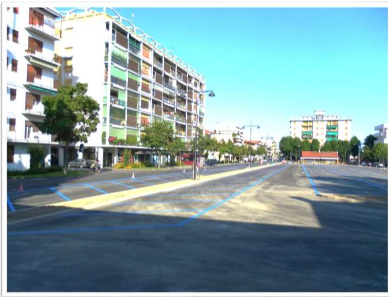
San Donà di Piave il nuovo parcheggio di piazza Rizzo ultimato