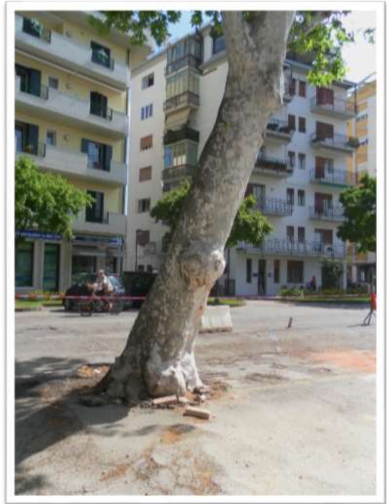
Archivio club 54 San Donà Piazza Rizzo due vecchi platani prima di essere abbattuti