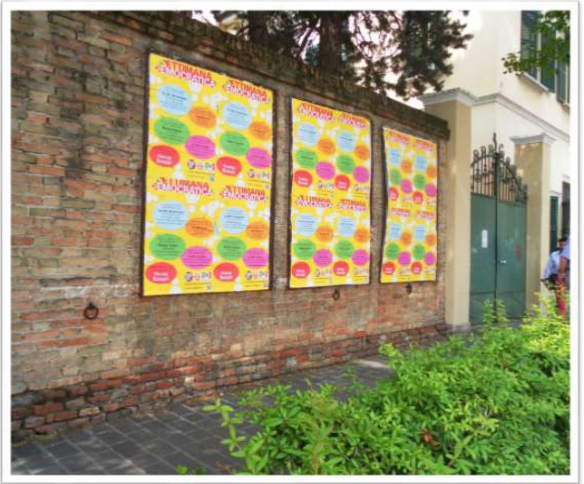
Archivio fotografico club 54 piazza Rizzo l'antico muro deturpato dalle pubbliche affissioni poco decorose