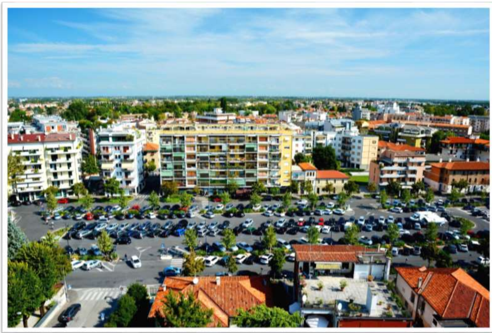
panoramica della nuova piazza A.Rizzo