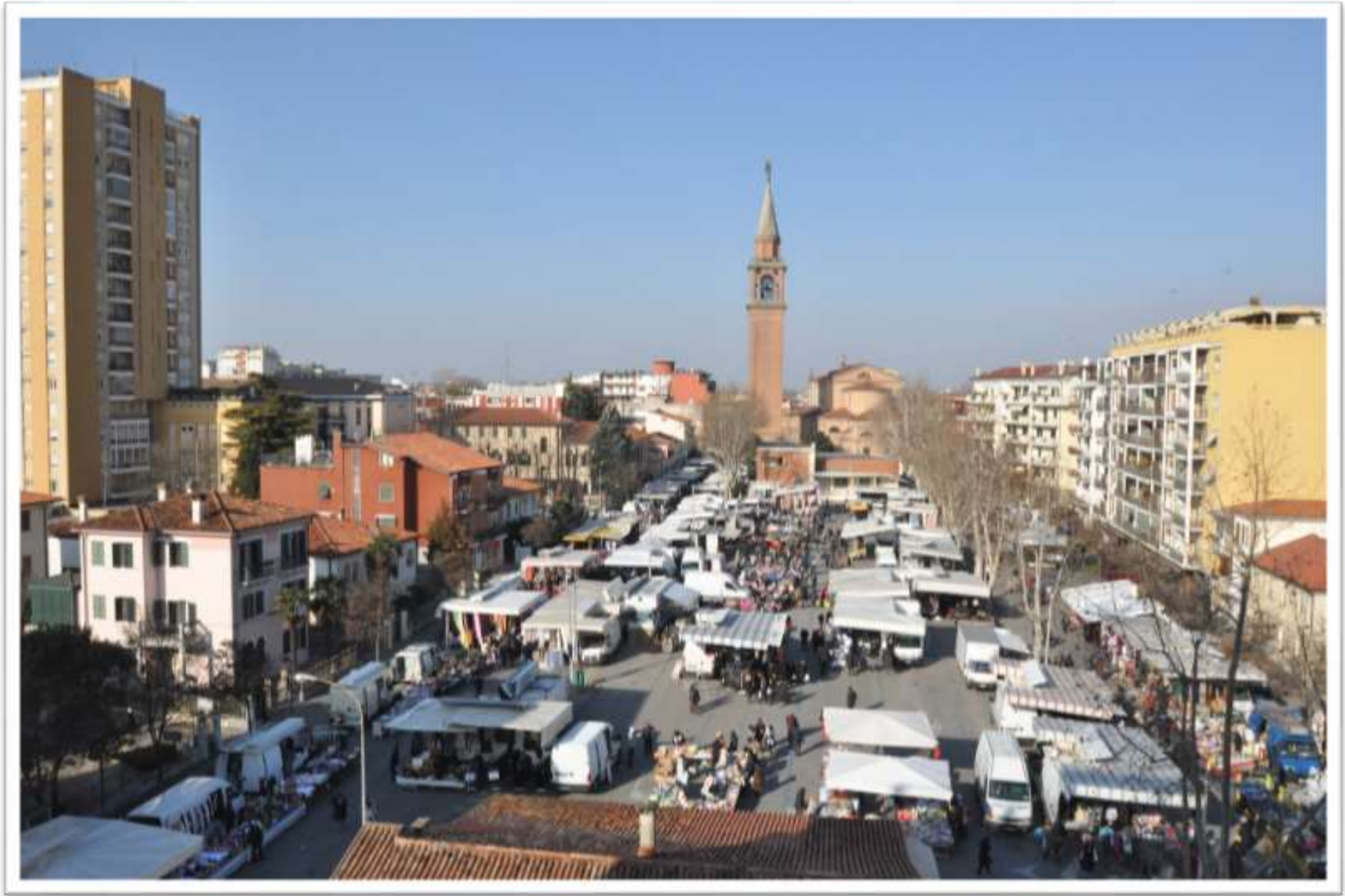
Archivio fotografico club 54 San Donà di Piave piazza A.Rizzo nel giorno di mercato prima della ristrutturazione