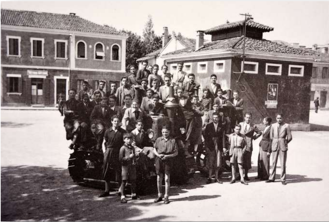
Archivio fotografico club 54 San Donà di Piave il Foro Boario alle spalle del Duomo foto di gruppo sopra un trattore con alle spalle i gabinetti pubblici ora si trova il palazzo delle poste anno 1938.