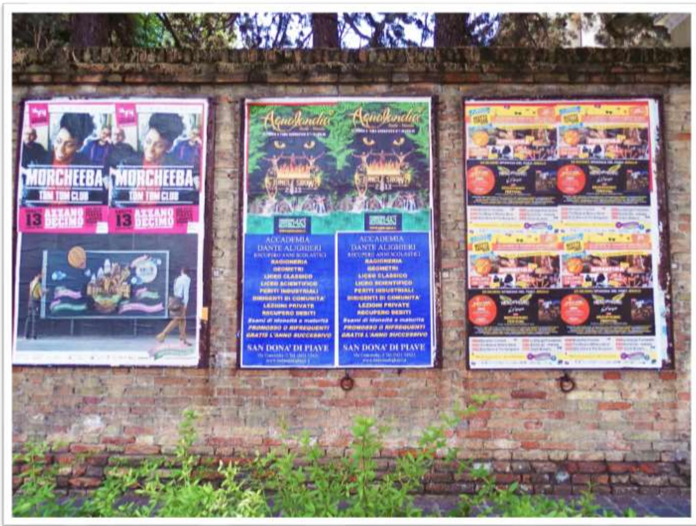
Archivio fotografico club 54 San Donà di Piave piazza Rizzo ex foro boario parte del vecchio muro di cinta dell'asilo S.Luigi in mattoni faccia a vista con ancora infissi gli anelli in ferro (scione) ai quali veniva legato il bestiame nel tradizionale mercato del lunedì