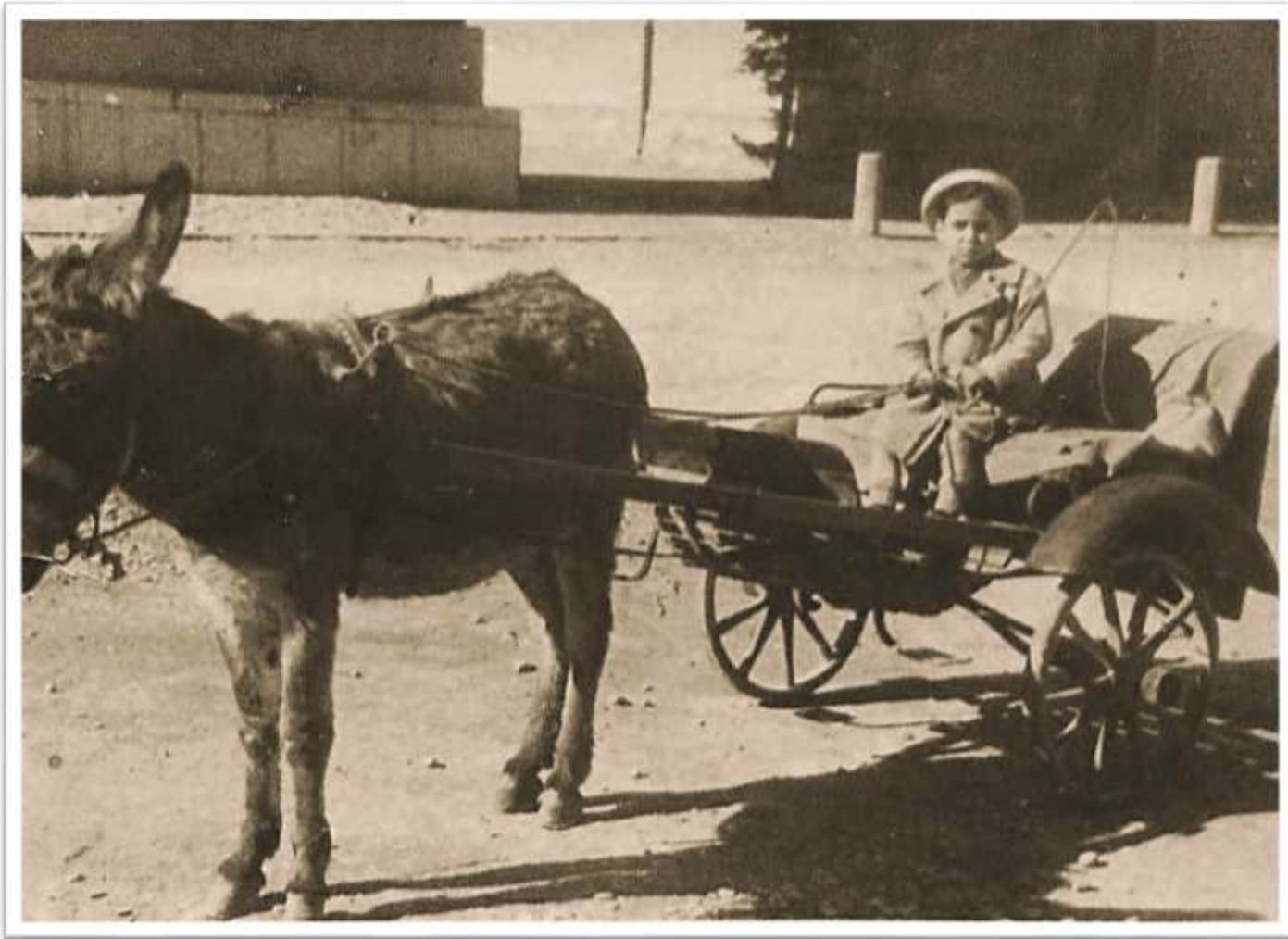
Archivio fotografico club54 San Donà di Piave così si poteva circolare in piazza Rizzo sul retro del campanile anno 1950