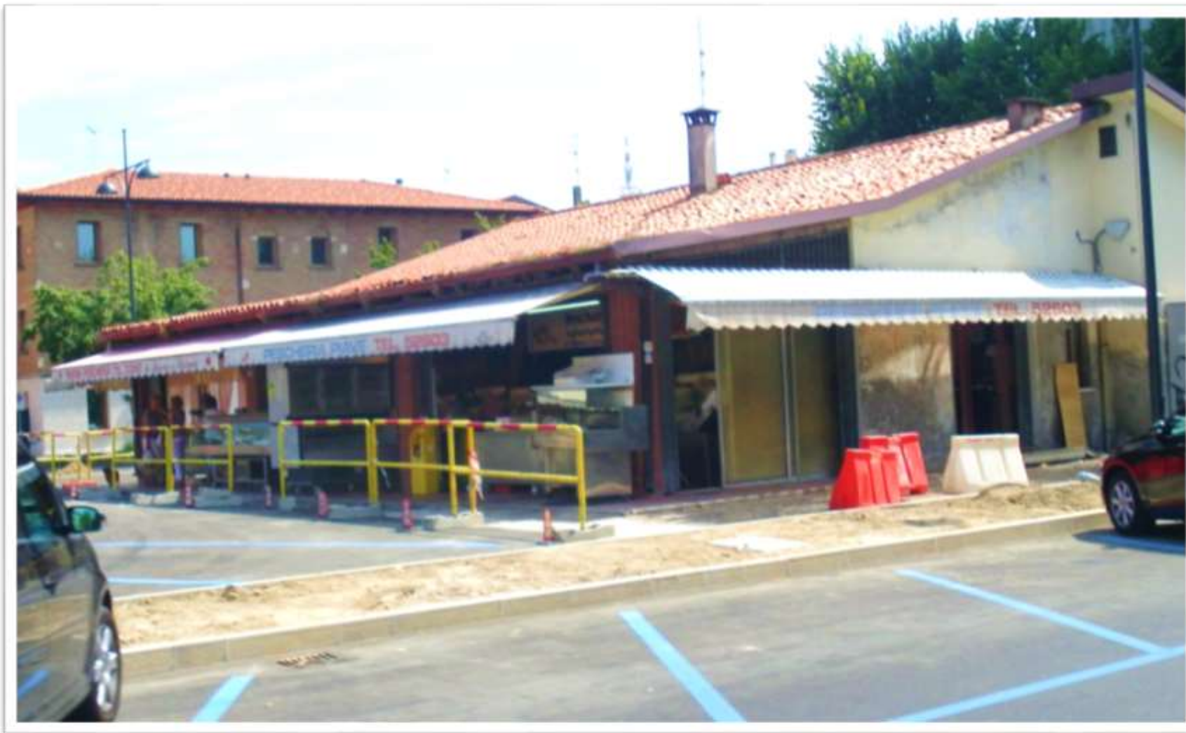
piazza Rizzo ultimi giorni della pescheria prima della sua demolizione anno