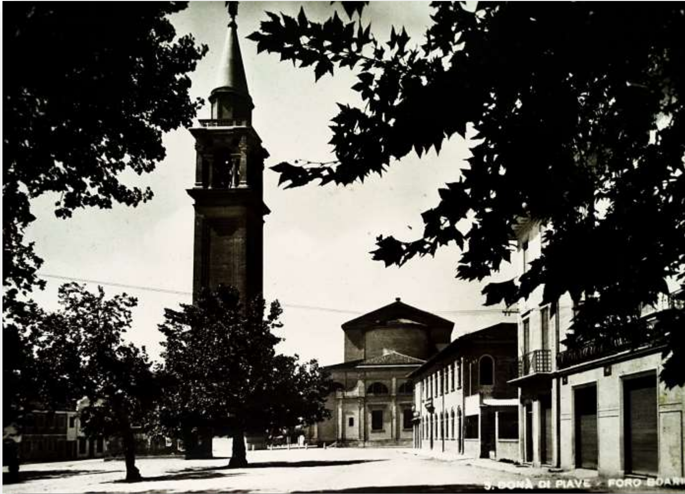
Archivio fotografico club 54 San Donò di Piave il Foro Boario le nuove costruzioni nel 1928 lato sinistro