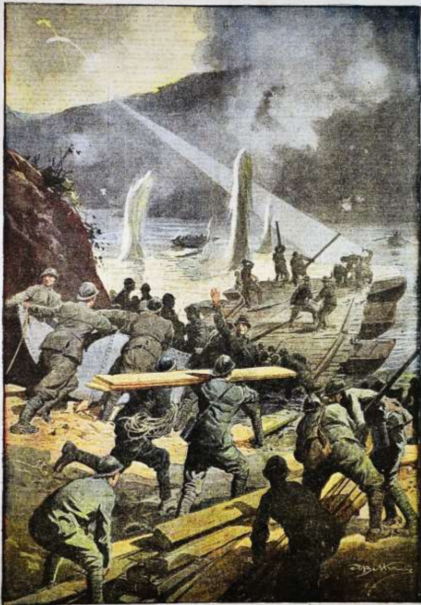
Gli eroi della nuova offensiva. I valorosi postieri aprono la via alla conquista, preparando il passaggio dell'Isontina a nord di Authova.