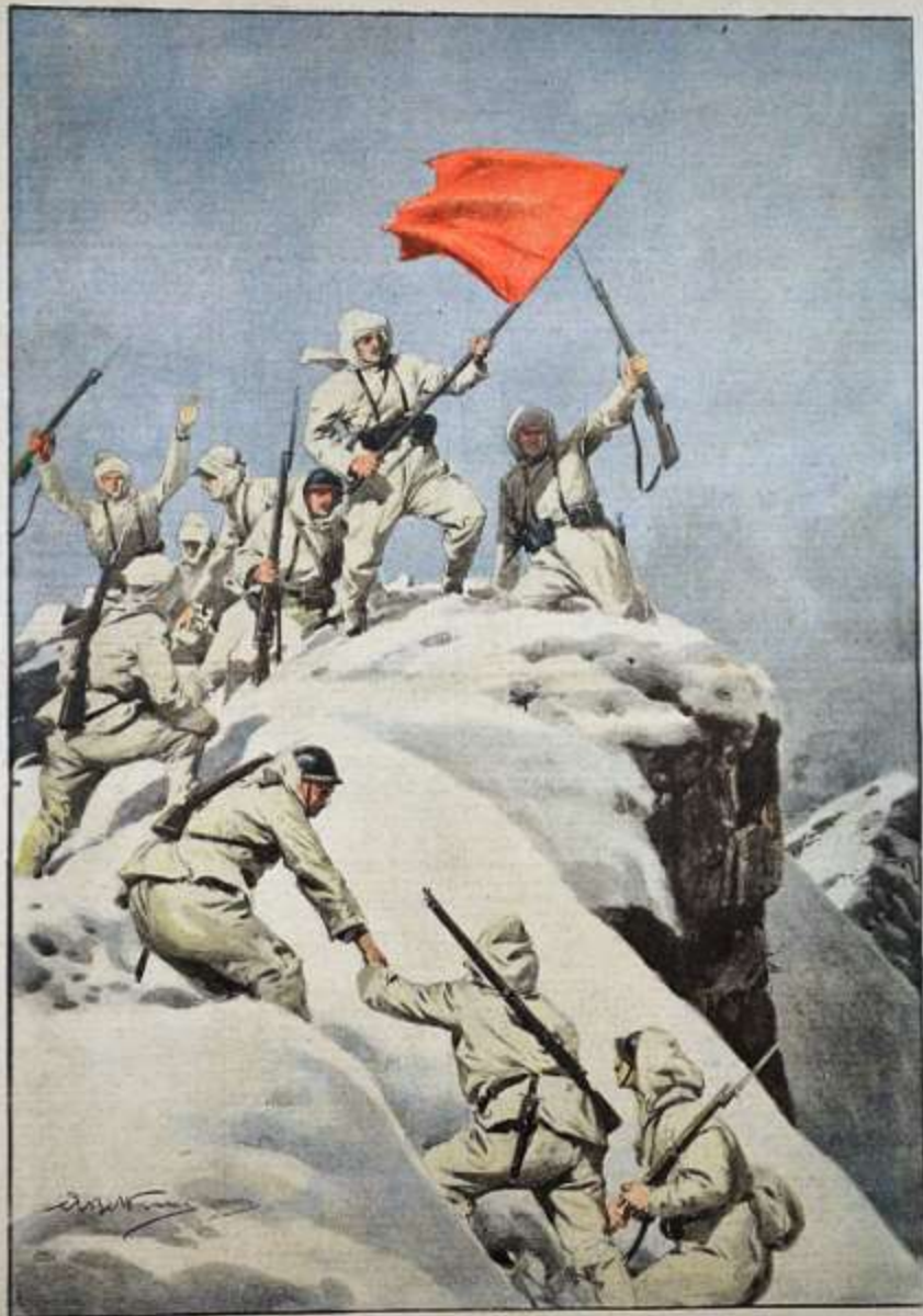
La guerra sui ghiacciai. Gli alpini con la loro bandiera vittoriosa raggiungono Cima del Zigdon.