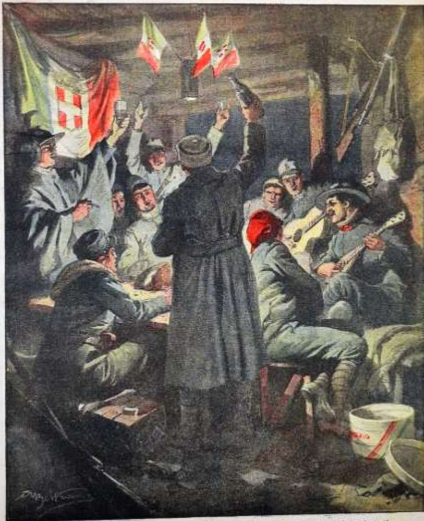
Natale di guerra 1915 - In ridotta, il brindisi: "Alla grandezza della Patria, alla salute dei cari lontani". Disegno di A. Estremo.

Per tutti gli articoli e illustrazioni e osservare le proprietà letterarie e artistiche, secondo le leggi e i trattati internazionali. Anno XVII. - Num. 62. - 25 Dicembre 1915 - 2 Gennaio 1916. - Costo del numero.