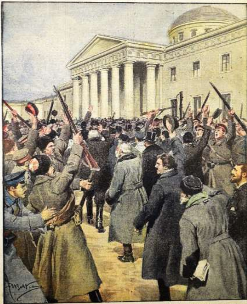
L'insurrezione russa per la libertà e la guerra. Le truppe acclamano i deputati che entrano alla Duma.