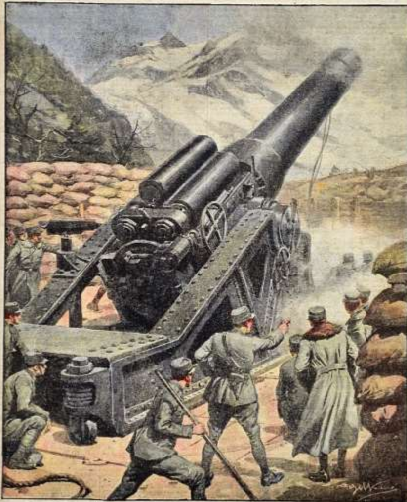
Il colosso della nostra artiglieria: un "305", al momento dello sparo.

Per tutti gli articoli e informazioni si rivolga a Direzione, Amministrazione o Redazione, secondo le leggi e i statuti istituzionali. ANNO LVII - N. 21 - 18 - 50 Dicembre 1914. - Costo del numero.