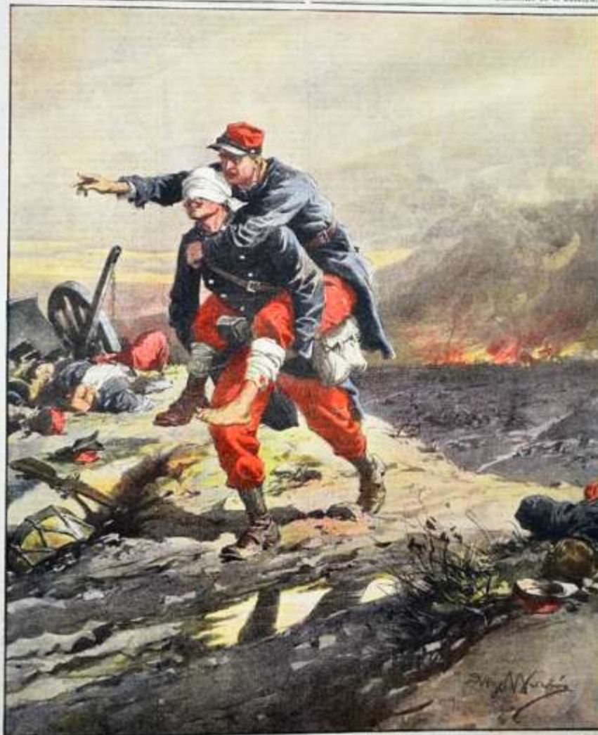
Episodi di guerra: due soldati francesi, uno accecato ed uno ferito ad una gamba, si aiutano a vicenda per raggiungere l'ambulanza.