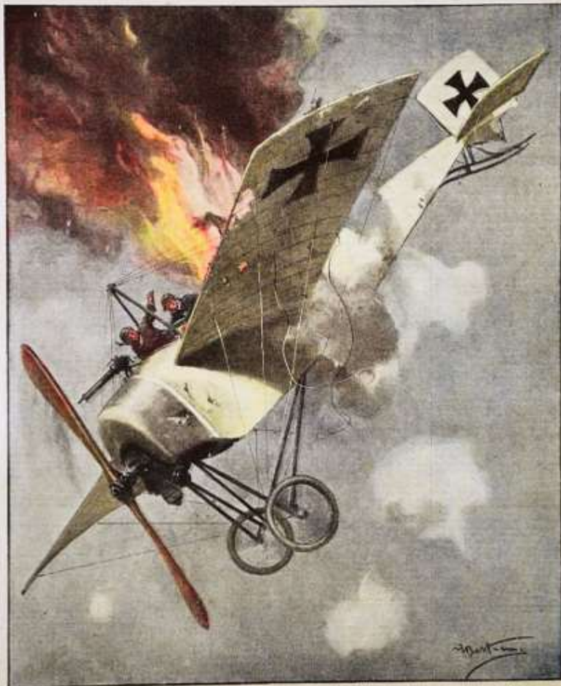
Come la parit' un'incursione aerea: la fine di un aeroplano austrico colpito dal nostro fuoco, nelle vicinanze di Sussega. Disegno di G. Mantoni.