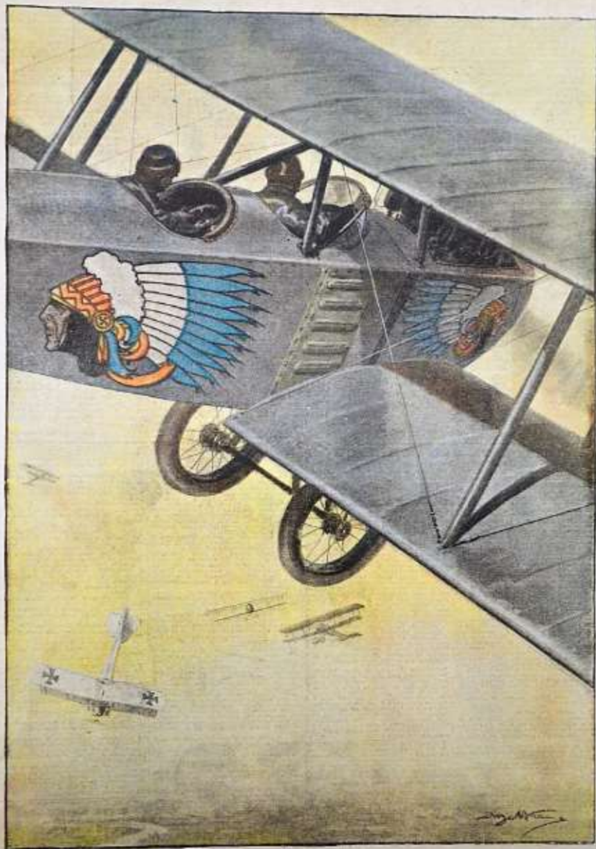
Volivoli d'America nei cuochi della battaglia in Francia. I tedeschi già conoscono l'audacia degli aviatori americani, e hanno imparato a temere le mimantoni "testa d'indiano", che distinguono una celebre squadriglia che si intitola a Lafayette.