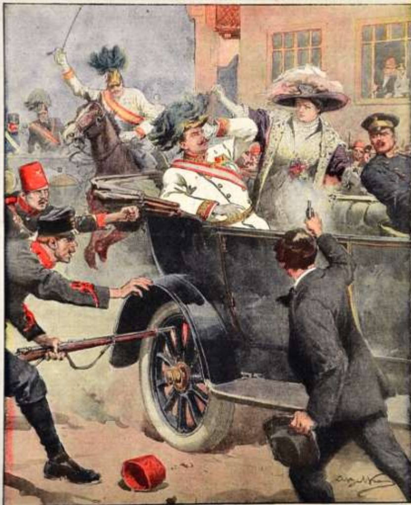
L'assassinio a Sarajevo dell'arciduca Francesco Ferdinando erede del trono d'Austria, e di sua moglie. (Disegno di A. Estévez)