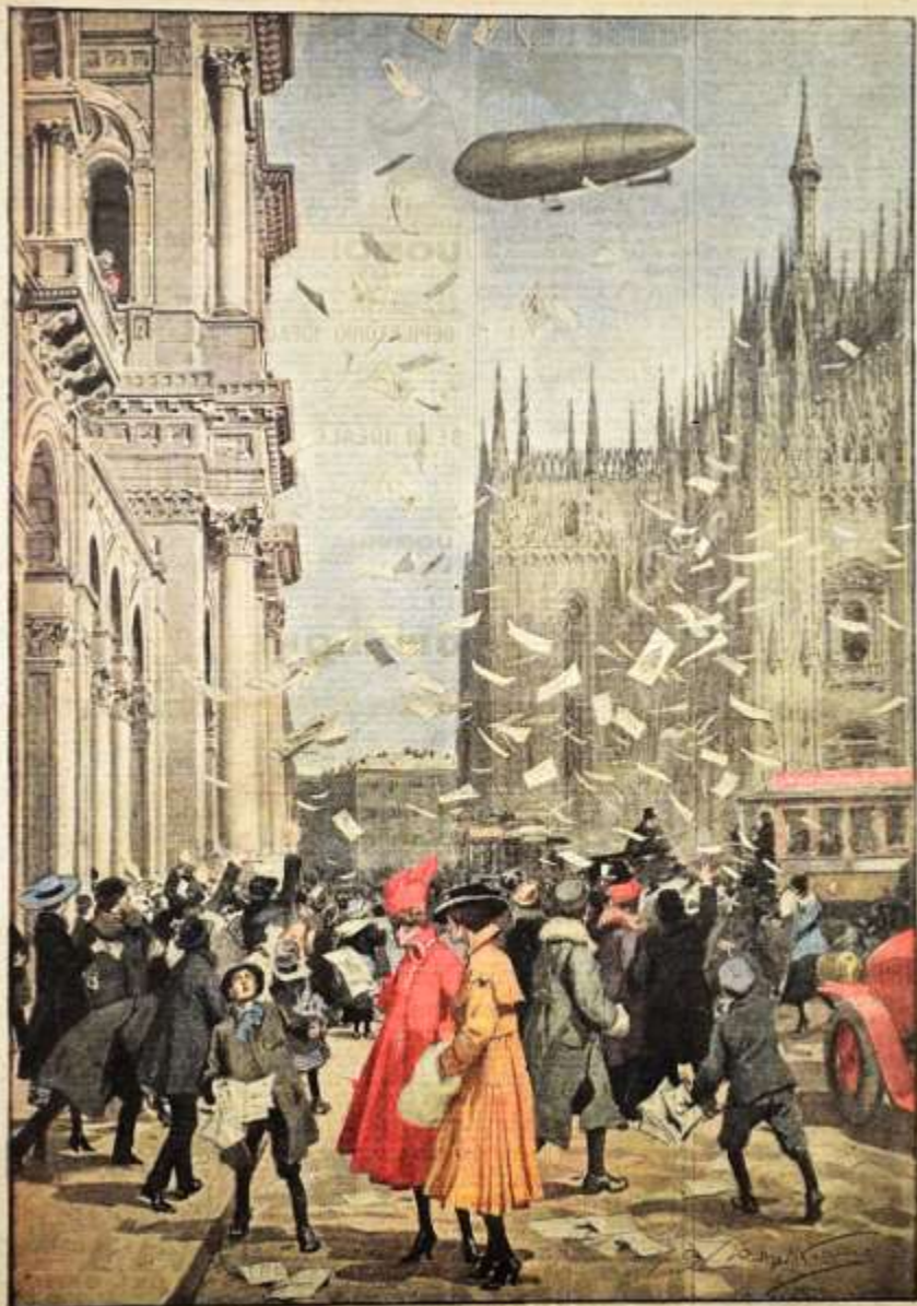
La propaganda per il Partito Nazionale a Milano: un dirigibile lancia fogli colorati sulla Piazza del Duomo. Disegno di A. Bizzozzi.