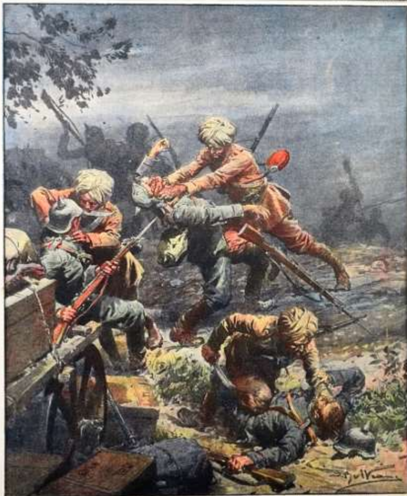
La conquista di una polveriera presso Ostenda: sentinelle tedesche sorprese e strangolate dagli indiani.