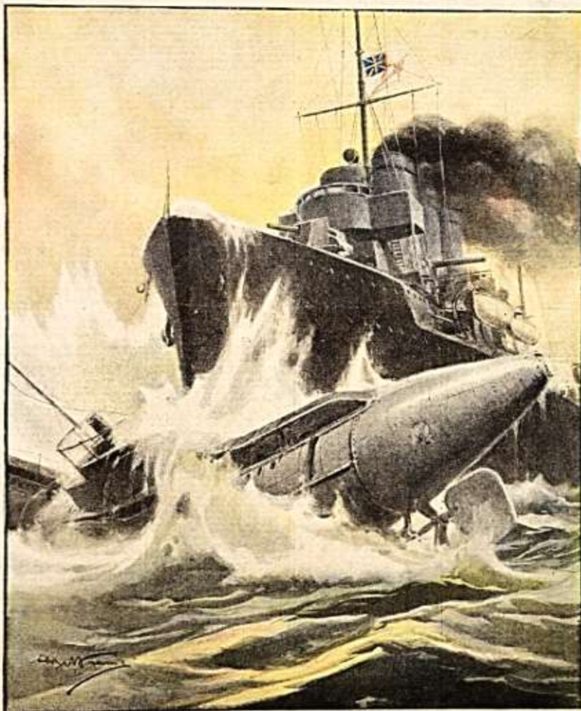
LA FINE DI UN PIRATA. Un cacciatorpediniere inglese, recentemente avvistato da sommergibile tedesco a meno di venti miglia, subito iniziò la caccia. Il sommergibile aveva rapidamente scaricato i gasi, e non fece in tempo a sommergersi. Senza esitazione, il cacciatorpediniere gli mosse contro a tutta velocità e lo spacò in due.