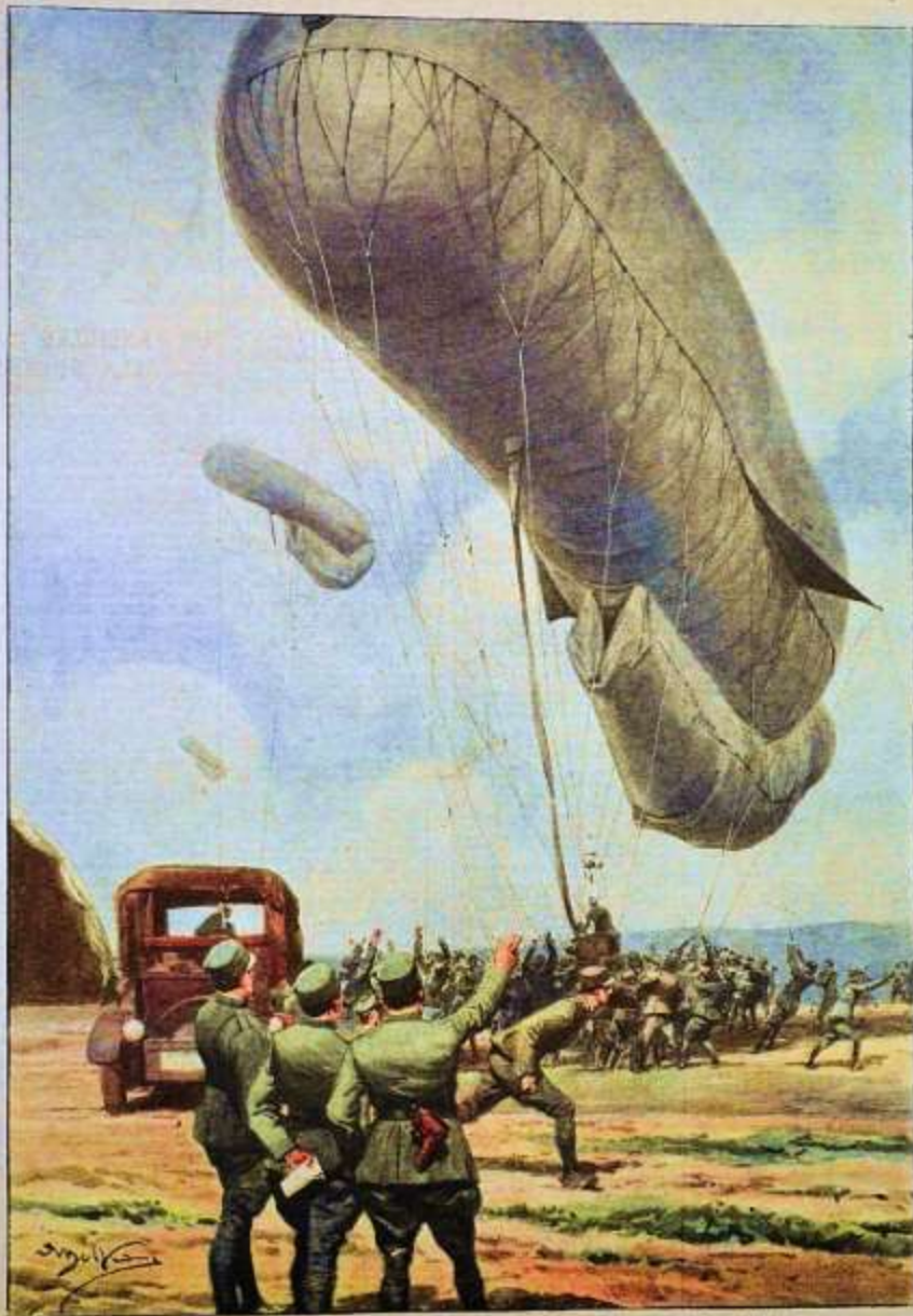
Sull'Isonzo: manovra di sollevamento di "pulloni-drago" per dirigere i tiri delle artiglierie. (Disegno di A. Baccarelli)