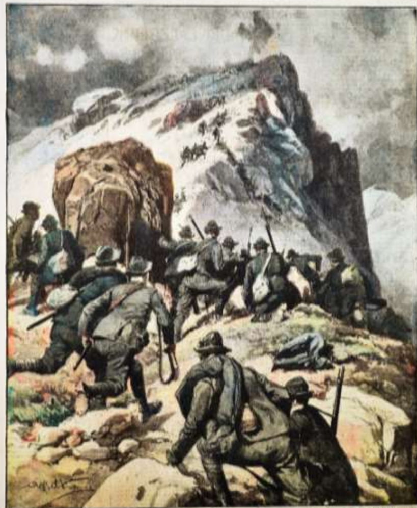
« Nella zona di Enna (Siracusa) dopo una accanita, gli alpini occuparono l'intero area del Monte Argentario sulla quale erano a 2400 metri. La posizione fu difesa valorosamente e fu in tutto il suo possesso. Furono presi al nemico una quantità di armi e munizioni. Tre i morti ed offesi. »

Per tutti gli articoli e illustrazioni è autorizzato lo stampatore, editore e direttore, associato di tutti i giornali illustrati. Anno XVIII. — 300. 31. — 18. 41. Settembre 1911. — Controllato in D. 20000.