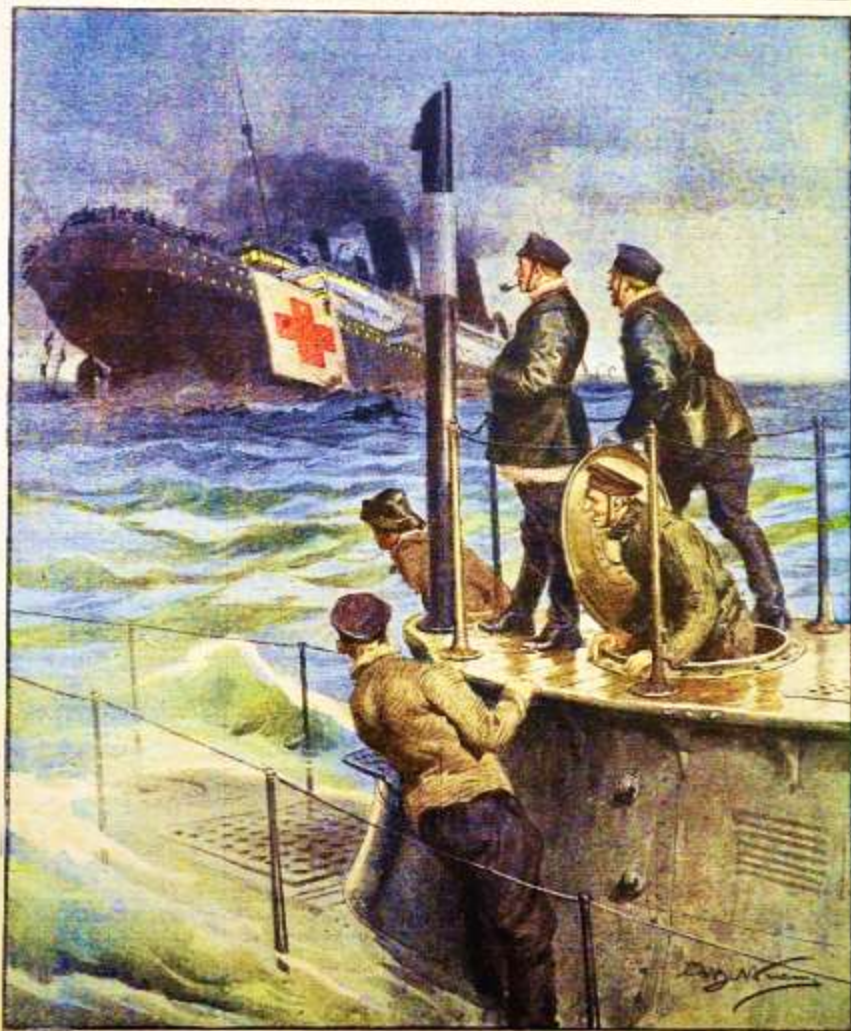
I nuovi fasti della pirateria tedesca. Il siluramento della nave-ospedale "Reva", nel Canale di Bristol.

Per tutti gli articoli e illustrazioni è riservata la proprietà letteraria e artistica, secondo le leggi e i trattati internazionali. Anno XX. — Num. 3. 20 - 27 Gennaio 1910. Centesimi 10 il numero.