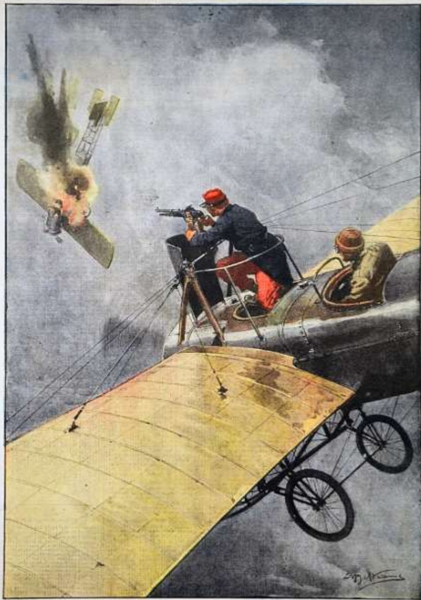
La guerra aerea: emozionante duello fra un aeroplano francese ed uno tedesco nella regione di Reims.