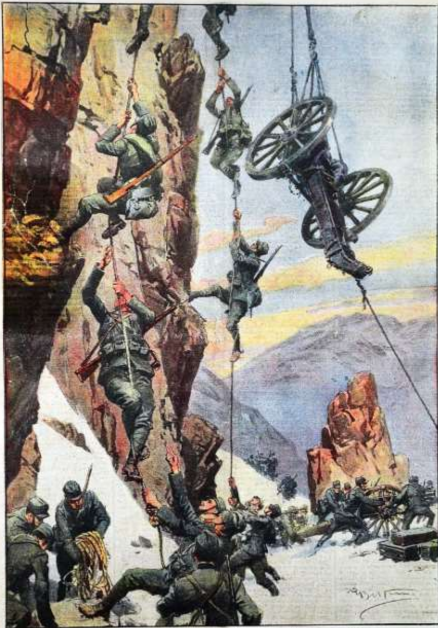
(Gli ardimenti dei nostri: vette scalate con le corde, cannoni sollevati ad altezze vertiginose.