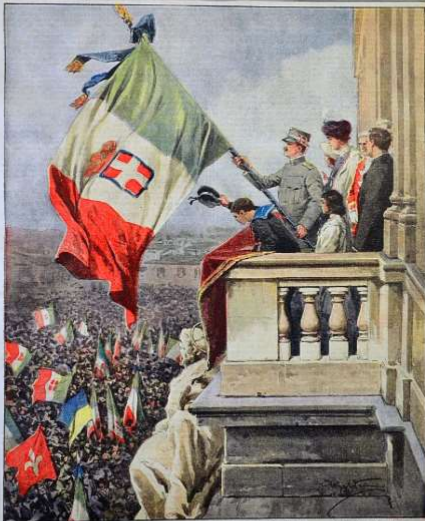
Una scena indimenticabile, nell'ora del cimento: il Re, dal Quirinale, sventola il tricolore e grida «Viva l'Italia!». (Disegno di A. Dittioni.)

NO. 2220 - ANNO L. 2 - L. 20 L. 20 - L. 20 L. 20 - L. 20 Si pubblica a Milano ogni Domenica Supplemento illustrato del "Corriere della Sera" Milano del giornale: Via Solferino, N. 22 MILANO Per tutti gli affari e illustrazioni a osservarsi la proprietà letteraria e artistica, secondo le leggi e i trattati internazionali. Anno XVII - Num. 22 18 Maggio - 6 Giugno 1912. Costo del numero.