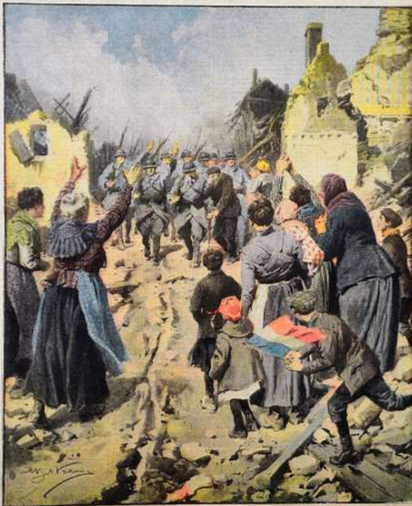
Nell'ora sognata della liberazione: «Giungono i nostri fratelli!» I superstiti di un villaggio francese strappato ai barbari, muovono incontro ai liberatori.

Per tutti gli articoli e illustrazioni è riservata la proprietà letteraria e artistica, secondo le leggi e i trattati internazionali. Anno XX. — Num. 43. — 27 Ottobre - 3 Novembre 1918. — Centesimi 10 il numero.