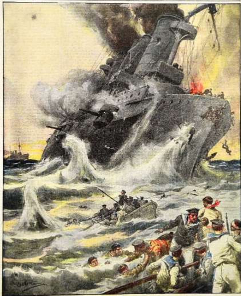
La fine di una nave di valore; l'incrociatore tedesco "Emden", distrutto dall'incrociatore australiano "Sydney".

Per tutti gli arretrati e abbonamenti e stampe in proprio, temeraria o artistica, secondo le leggi e i usi locali. Anno XVI - Num. 42. 22 - 28 novembre 1914. Costo del numero.