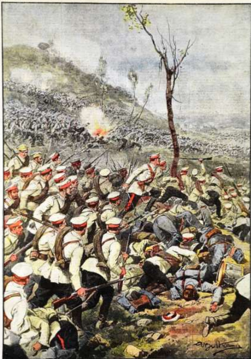
La guerra immane e terribile: valanghe di soldati nel Chocodon in Prussia ed in Galizia affrontando tedeschi ed austriaci.