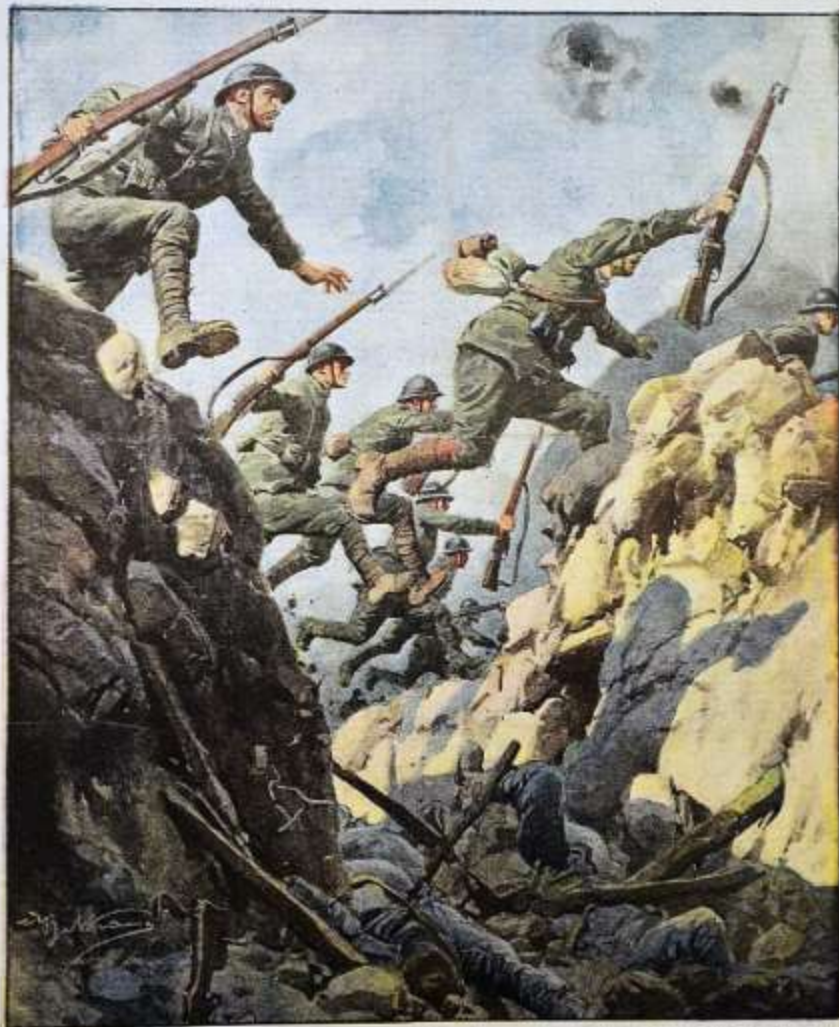
La conquista dell'Ortigara. - L'attacco alla quota 2105 si svolgeva sulla quota 2102, sempre in quel momento nella zona, nell'insediamento, da destra a sinistra. Era una condizione felice di uomini eroi, tutti eccitati di furore. (L. Sassi) (Disegno di S. Rocchini)

Per tutti gli arretrati e i richiedenti la ristampa in proprietà imperitura e esclusiva, vedete le leggi e i trattati internazionali. Anno XXX. Fasc. 28. 1-8 Luglio 1937. Cantieri 30 il numero.