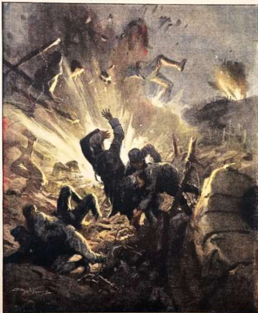
La guerra sotterranea: scoppio di mine sotto a sud-ovest di San Marino del Caese.