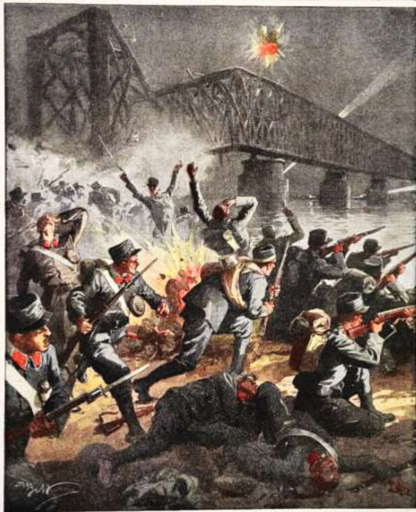
Inizio della guerra austro-serba: combattimento presso il ponte sulla Sava che unisce l'Austria alla Serbia. Disegno di A. Borello.

Per tutti gli articoli e illustrazioni o ritratti in proprietà letteraria o artistica, secondo le leggi e i trattati internazionali, Anno LVII. — Num. 52. 9 - 16 Agosto 1914. Costo del numero.