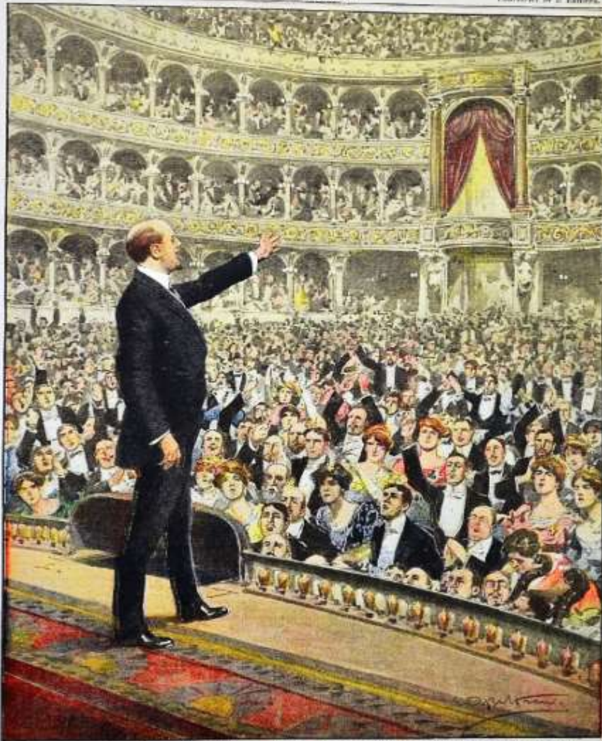
Le grandi manifestazioni contro il "giolittismo": Gabriele d'Annunzio parla al popolo di Roma, nel teatro Costanzi. (Disegno di A. Boltrone.)

Per tutti gli articoli e illustrazioni si riserva la proprietà letteraria e artistica, secondo la legge e i trattati internazionali. Anno XVII. - N. 21. 25 - 26 Maggio 1911. Costo del n. 2,00.