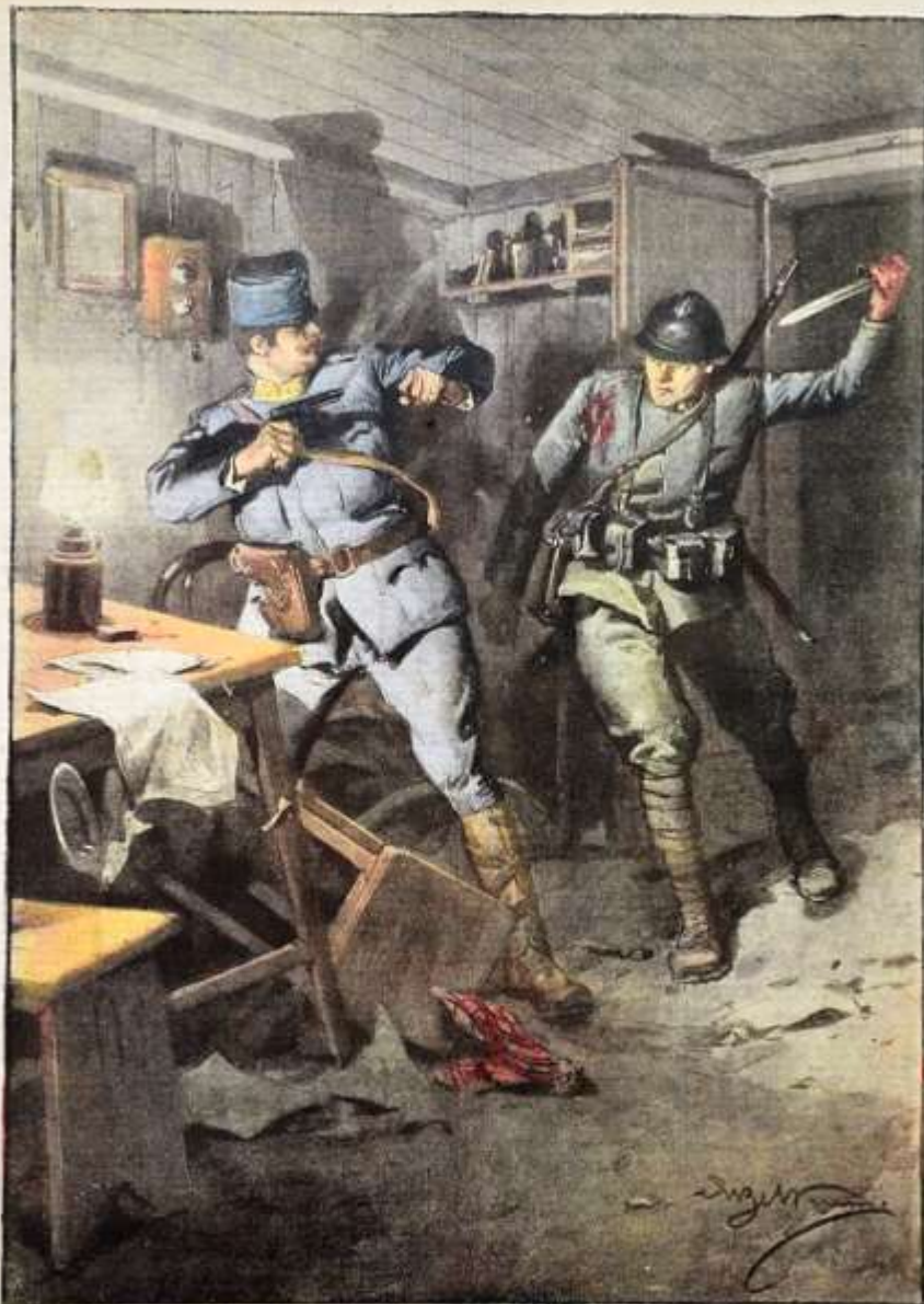
Al pari corte. Il drammatico duello, in una caverna, tra un alto ufficiale austriaco e un soldato italiano delle Fiamme Nere. (Disegno di G. Bazzani)