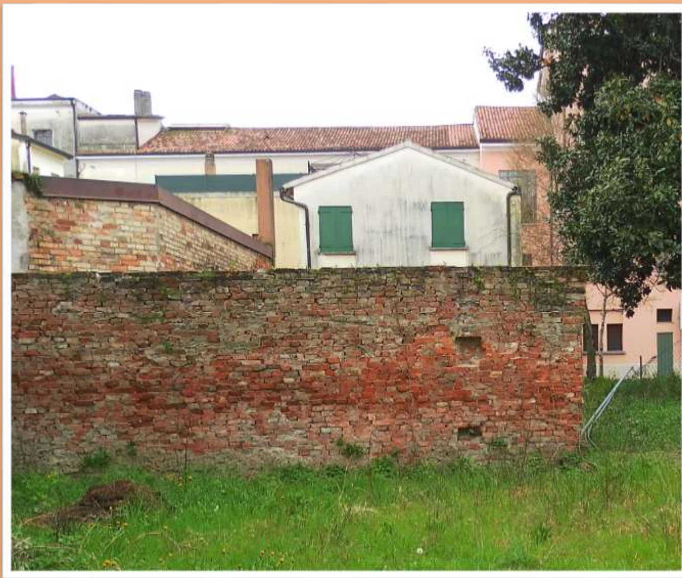
Vecchia mura perimetrale in mattoni faccia vista all'interno del Consorzio di bonifica