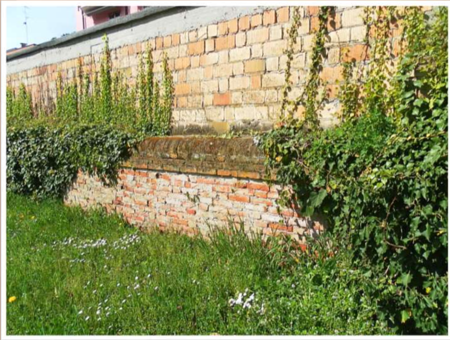
Resto di un pezzo di mura della villa Argentin