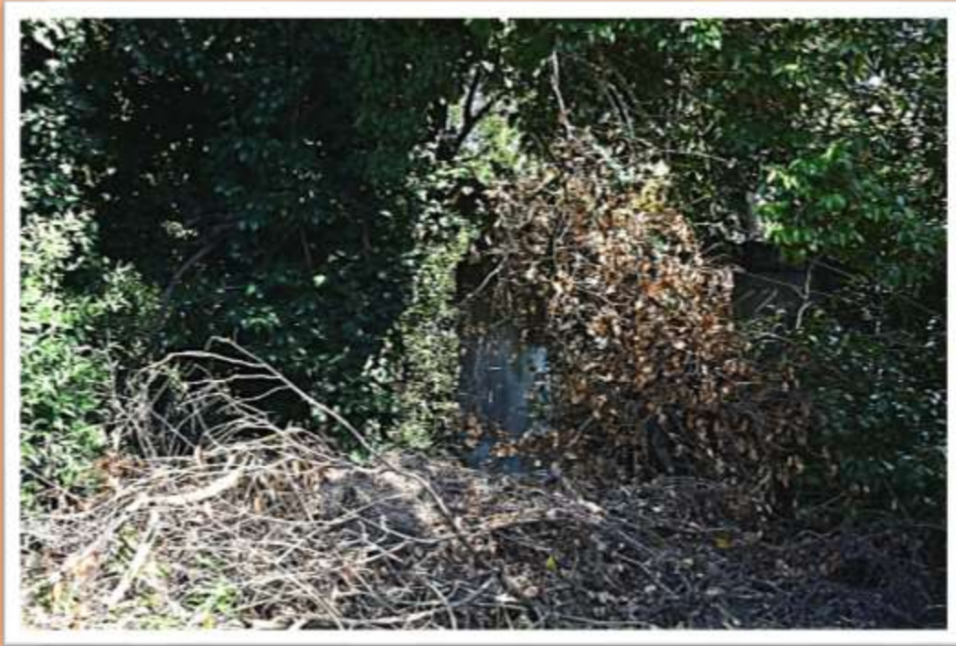
Ruderi di una vecchia stalla della villa De Faveri