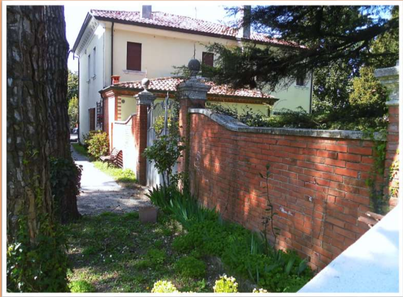
Un bel recupero di mura in mattoni con un cancello in ferro battuto all' entrata della villa Galletti