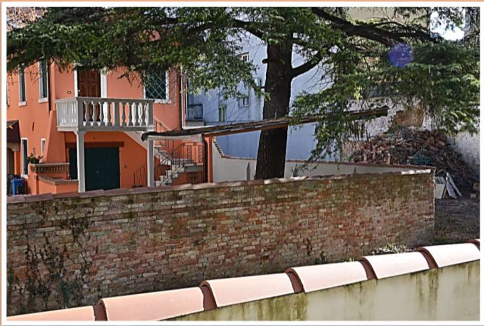
La vecchia mura in mattoni che delimita la proprietà Miotti in Vicolo Nuovo