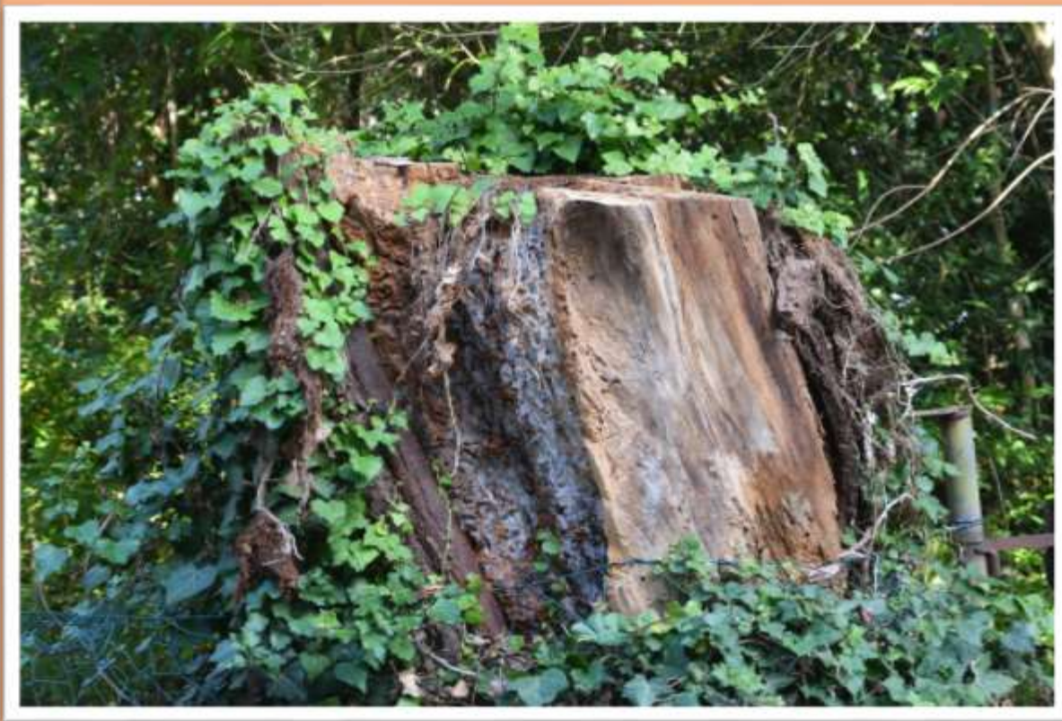
Quello che rimane di un salice piangente (selgher) tagliato perchè diveniva pericoloso ed era vecchio di quasi cento anni lo si vede in via Vicolo Nuovo