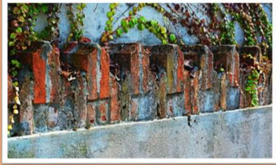
Quello che rimane della vecchia mura di cinta della vecchia caserma dei Carabinieri ora Banco San Marco in via XIII Martiri