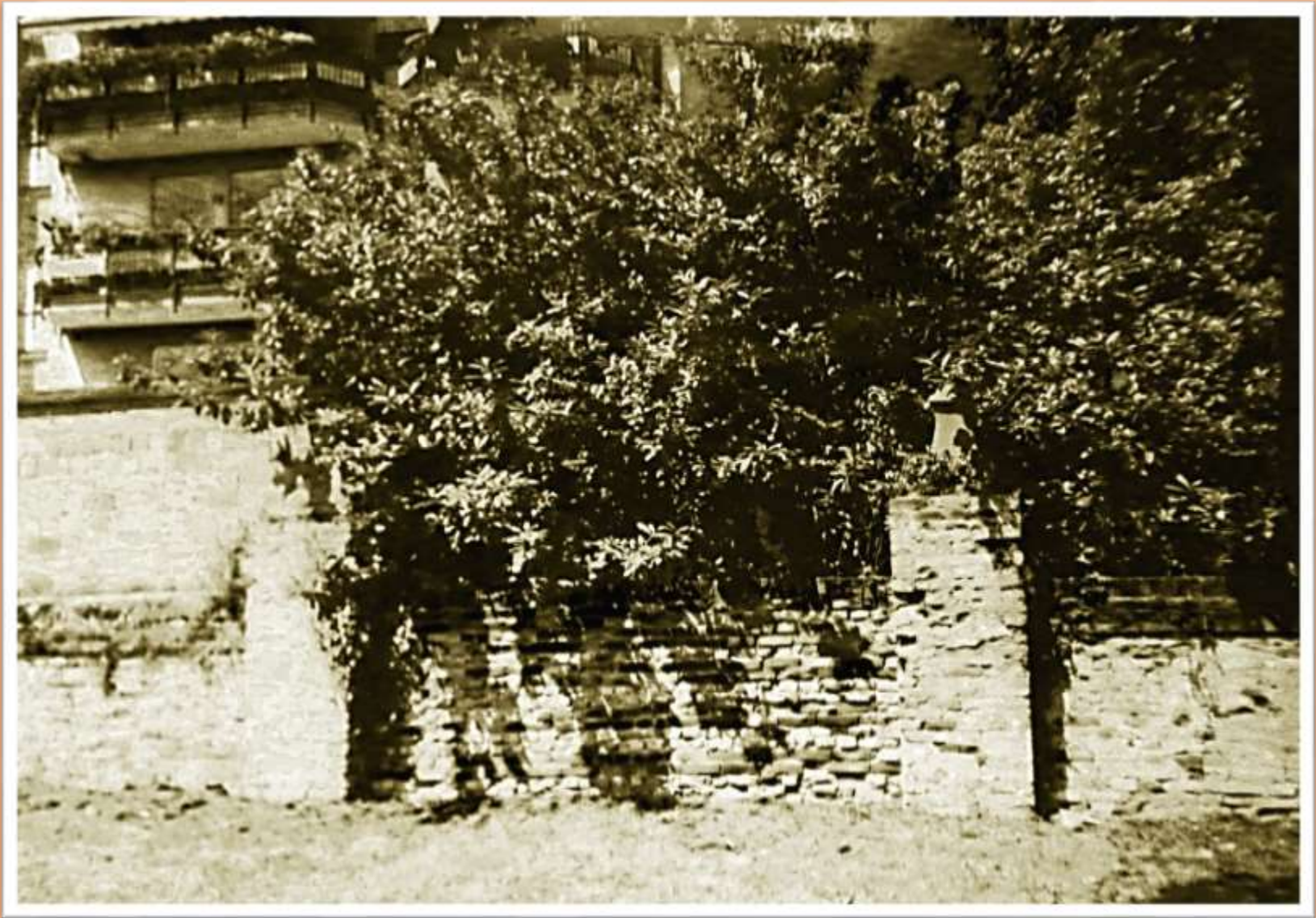
La mura perimetrale della villa ARGENTIN con la vecchia entrata murata ancora visibile dal parcheggio di via Brusade