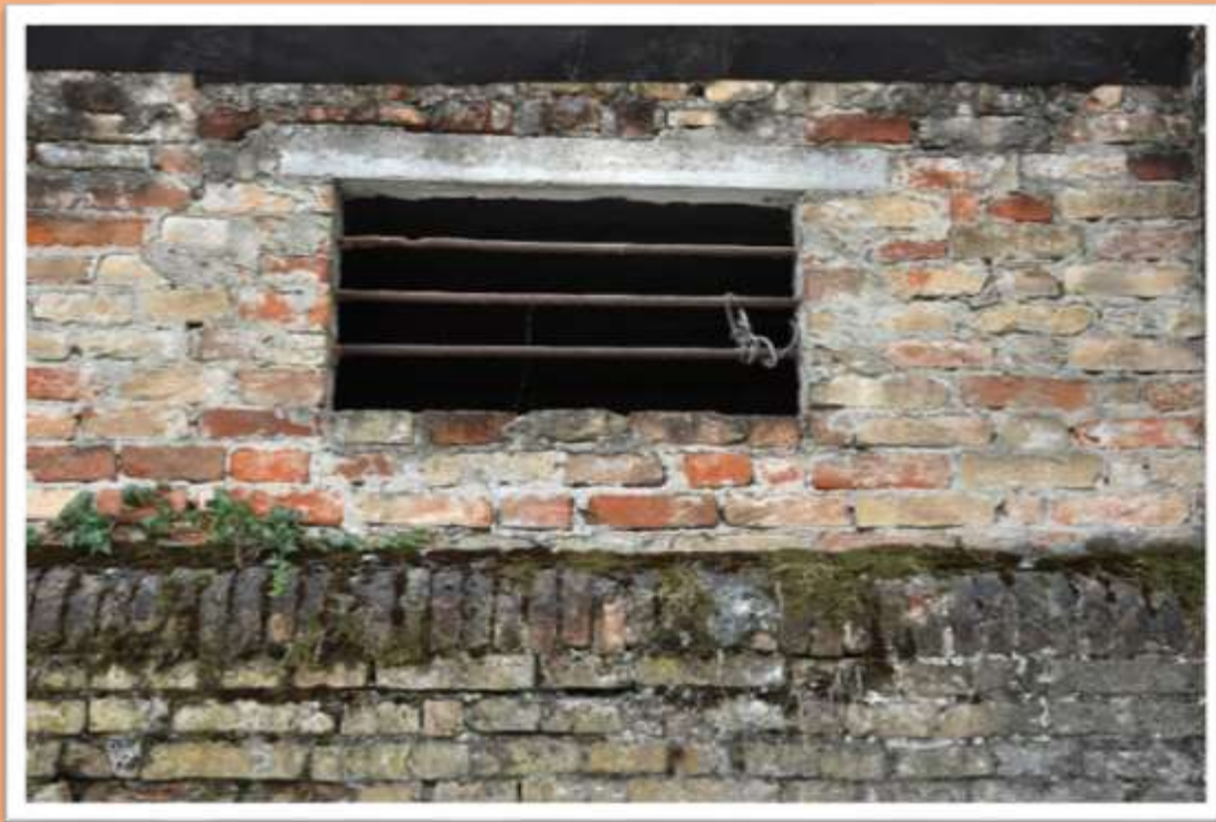
Particolari della vecchia mura