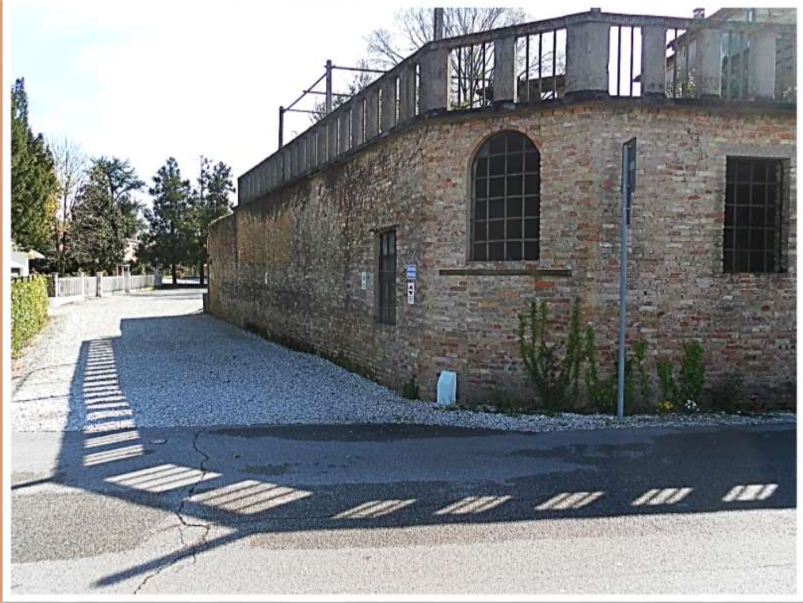
Vecchia costruzione in mattoni faccia vista che determina il perimetro della villa FAVA in via Brusade