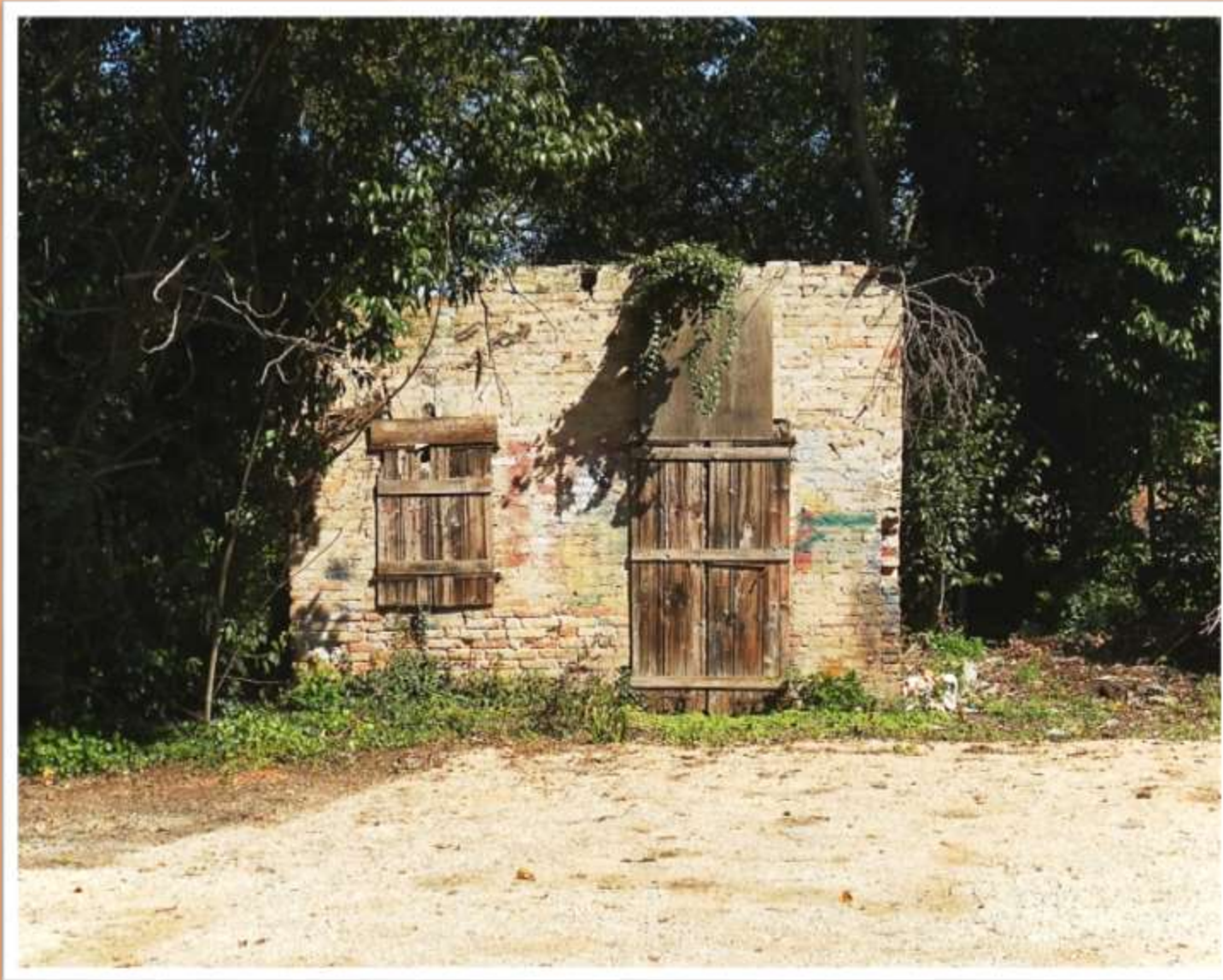
Quel che rimane di una vecchia stalla all'interano della villa De Faveri