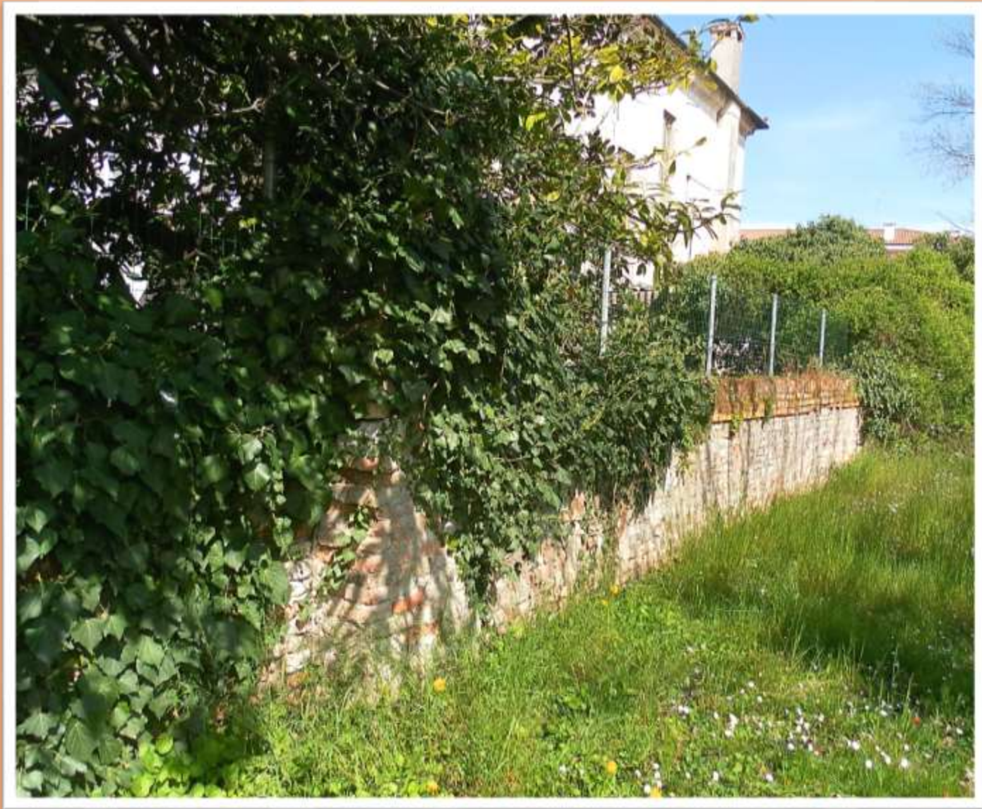
Altro particolare della mura in mattoni della villa Argentin ancora visibile