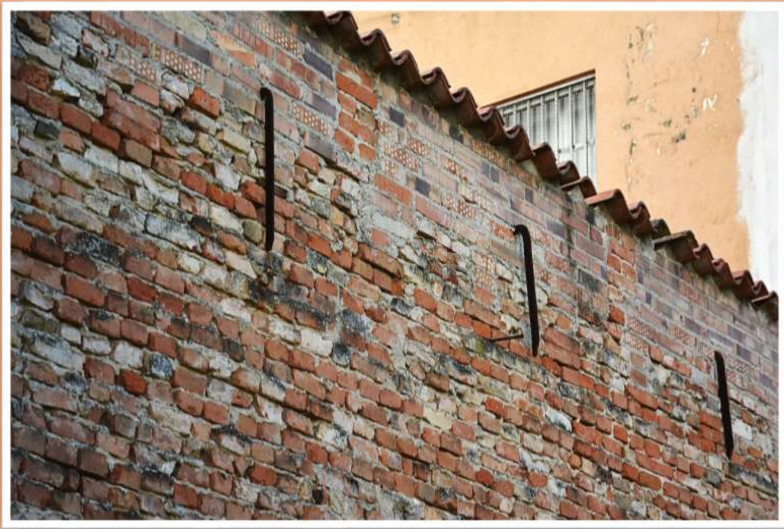
Particolare dei tiranti della vecchia mura perimetrale in mattoni faccia vista all'interno del giardino del Consorzio di Bonifica tuttora visibili