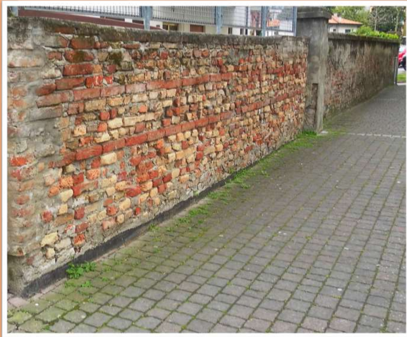
Un insieme della vecchia mura a confine del condominio Canova tuttora visibile in piazza Rizzo