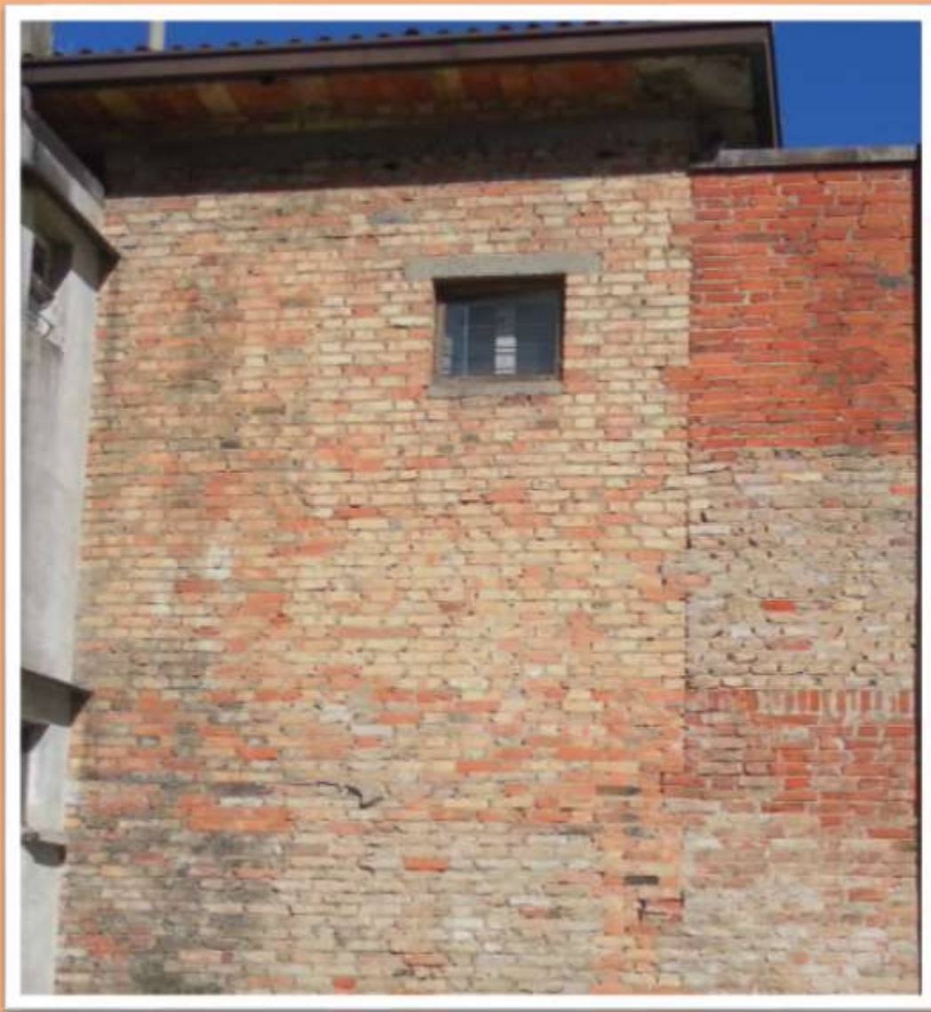
Vecchio muro faccia vista a confine del condominio Canova in piazza A. Rizzo