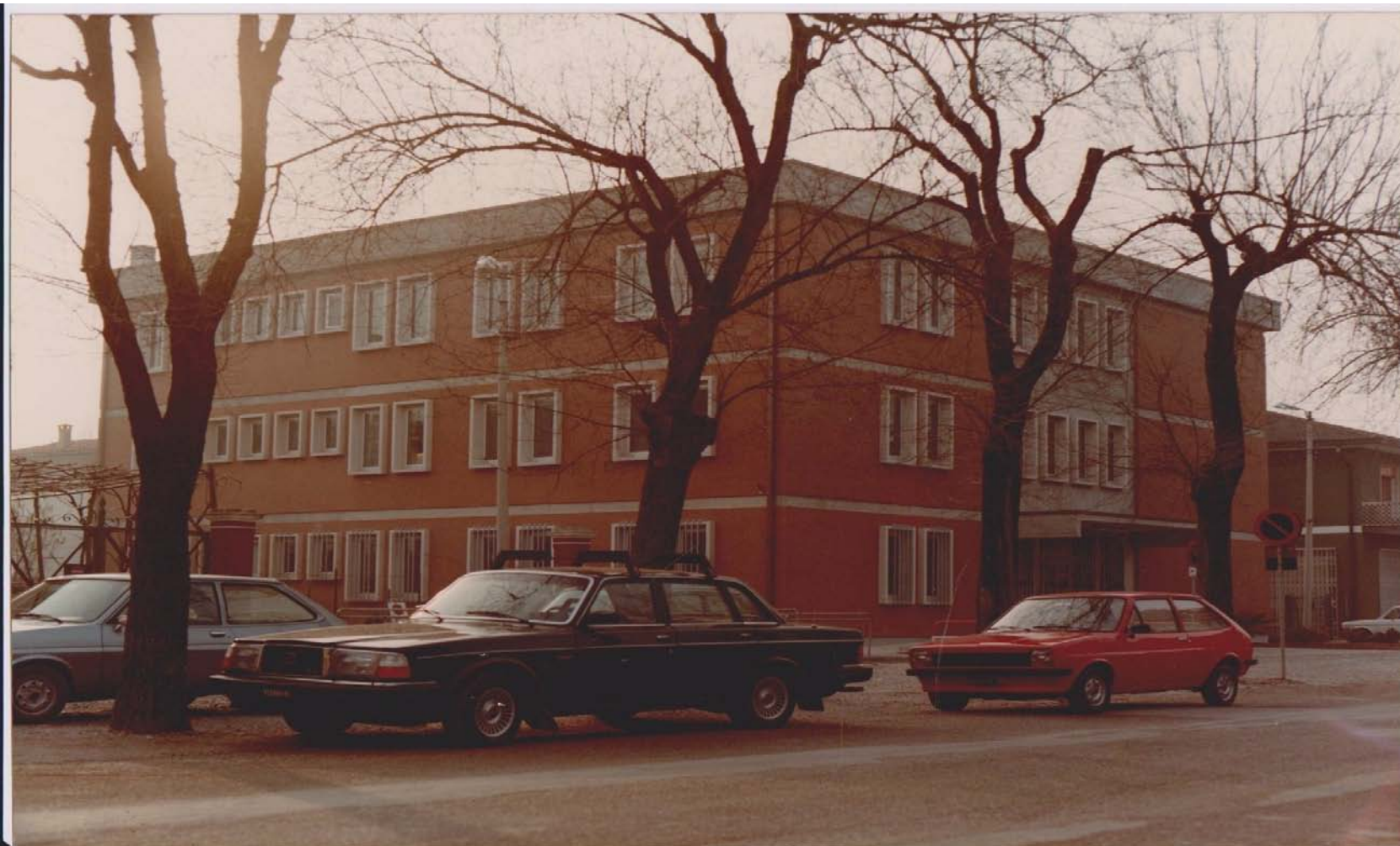
ARCHIVIO FOTOGRAFICO CLUB 54 IL NUOVO PALAZZO DELLA PRETURA VISTO DA VIALE LIBERTÀ