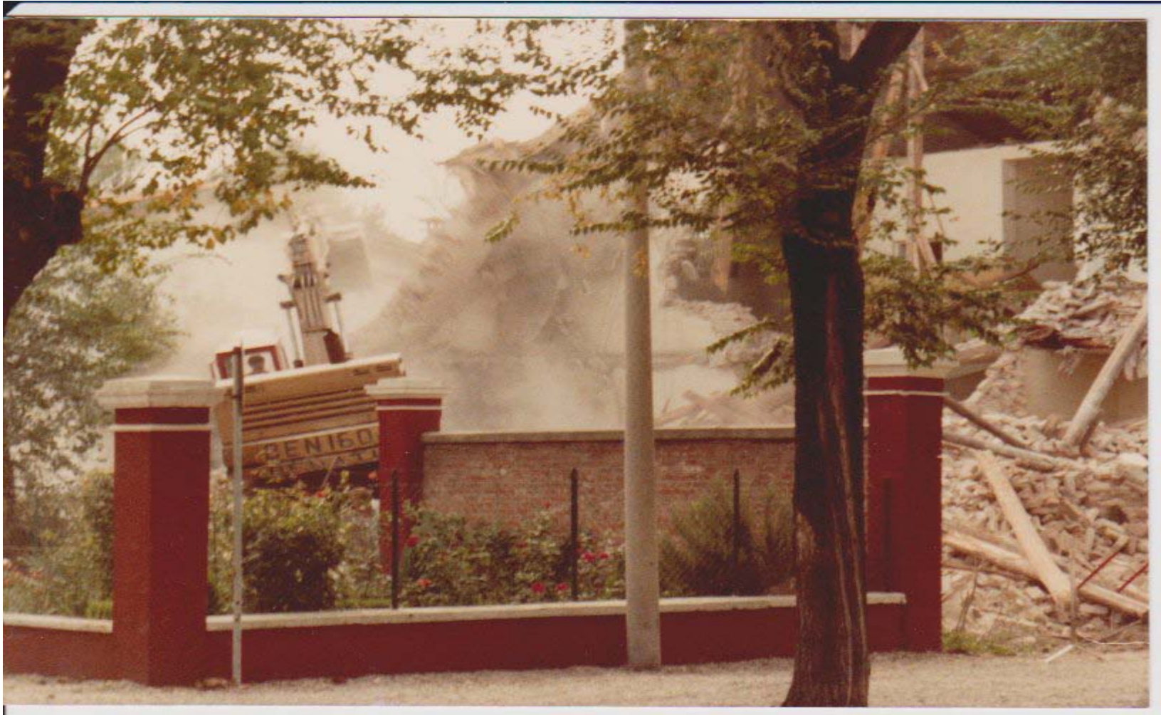
ALTRA IMMAGINE DELLA DEMOLIZIONE