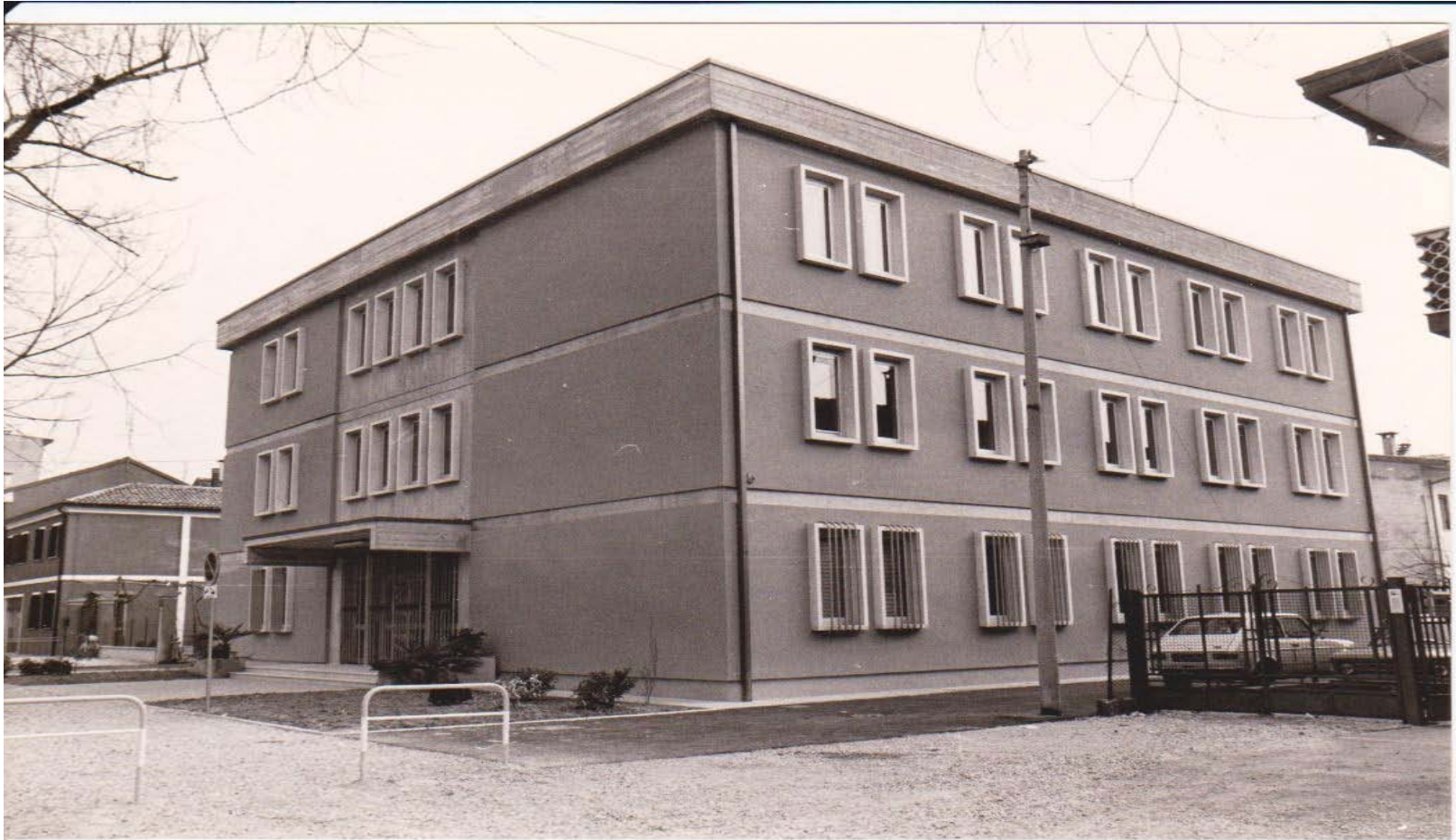
IL NUOVO PALAZZO DELLA PRETURA APPENA ULTIMO