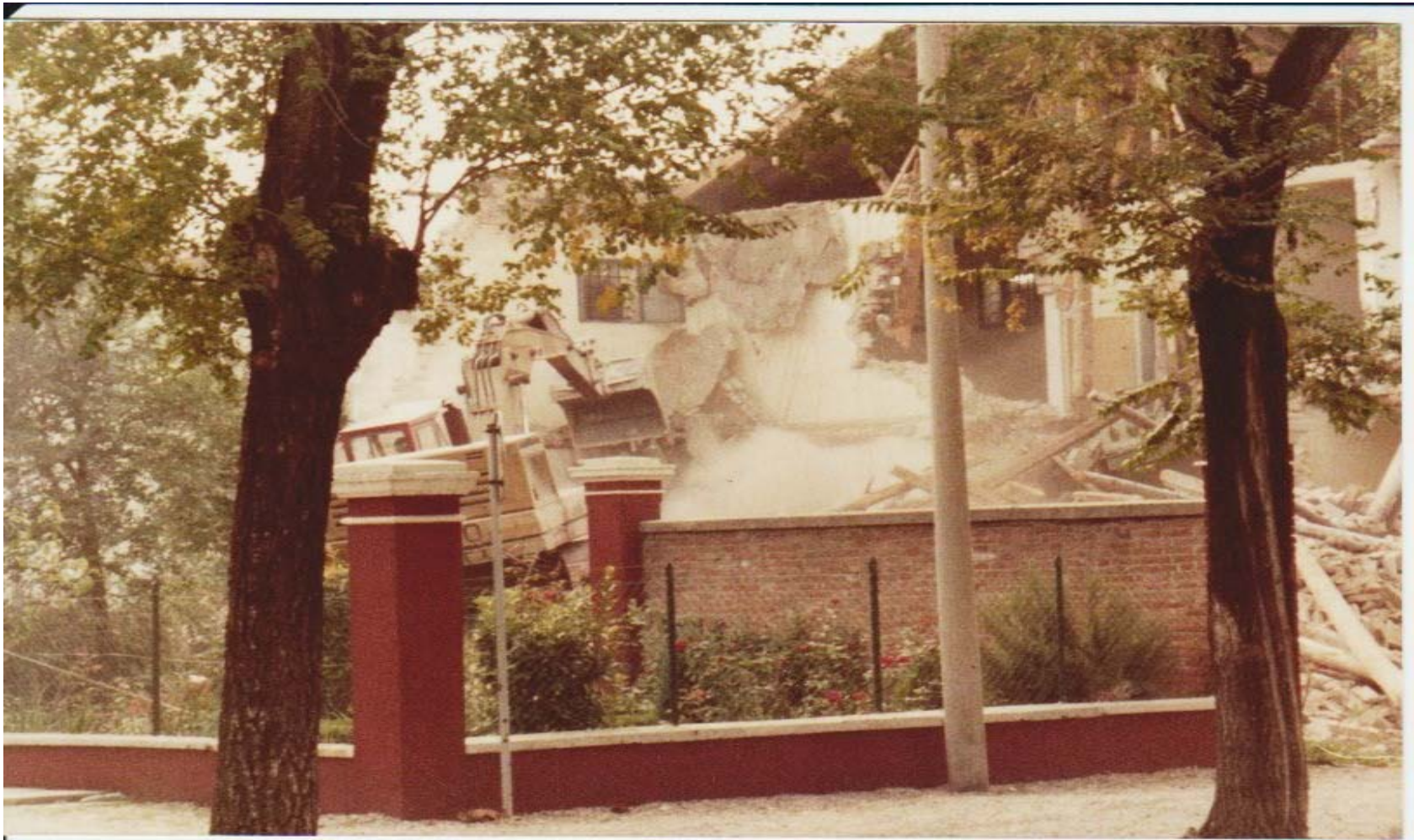
UNA RUSPA AGGREDISCE L' IMMOBILE DELLE CARCERI MANDAMENTALI