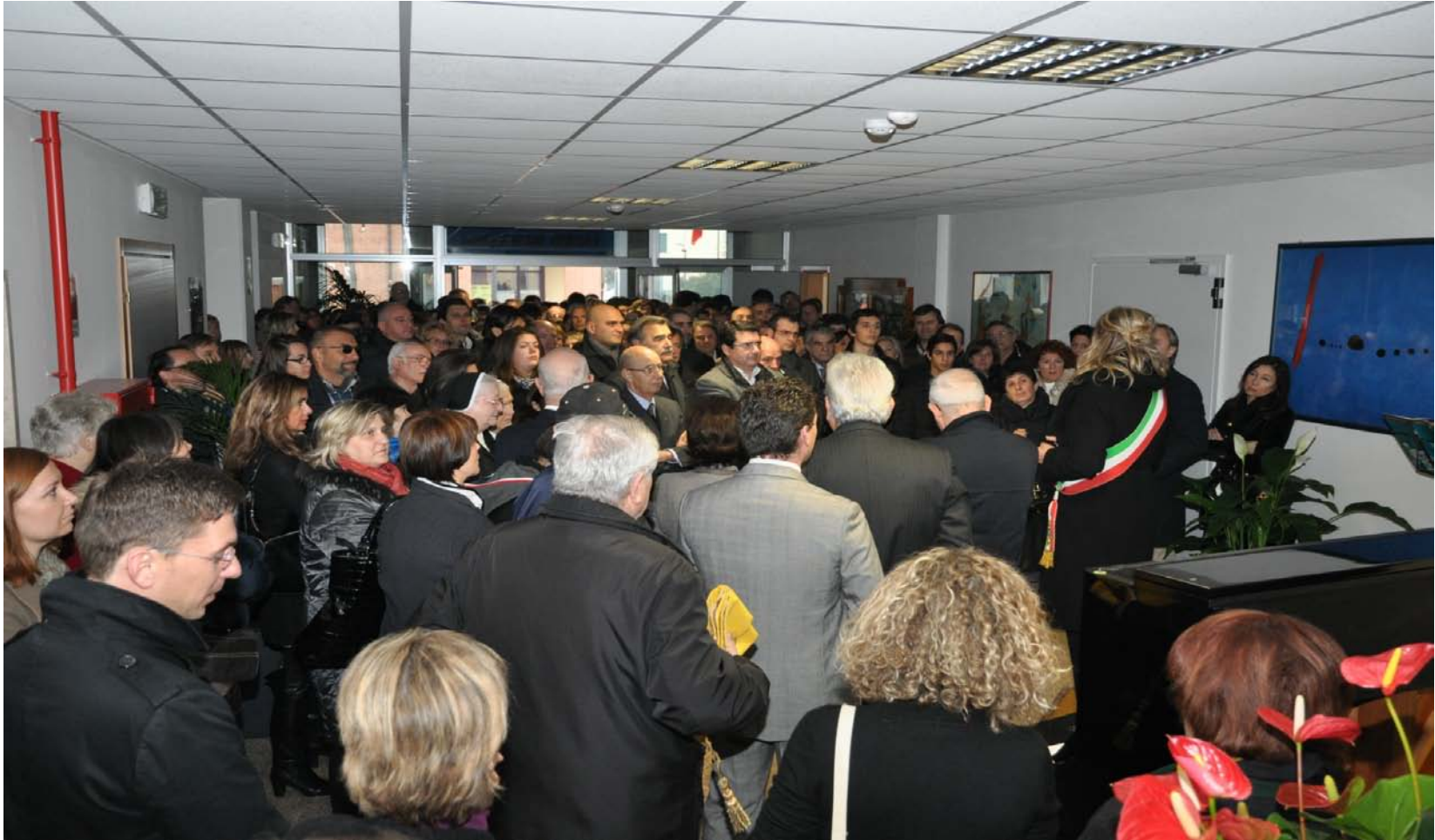
CLUB 54 FOTO DI A, MESTRE PUBBLICO AFFOLLA IL SALONE PER IL DISCORSO DI INAUGURAZIONE