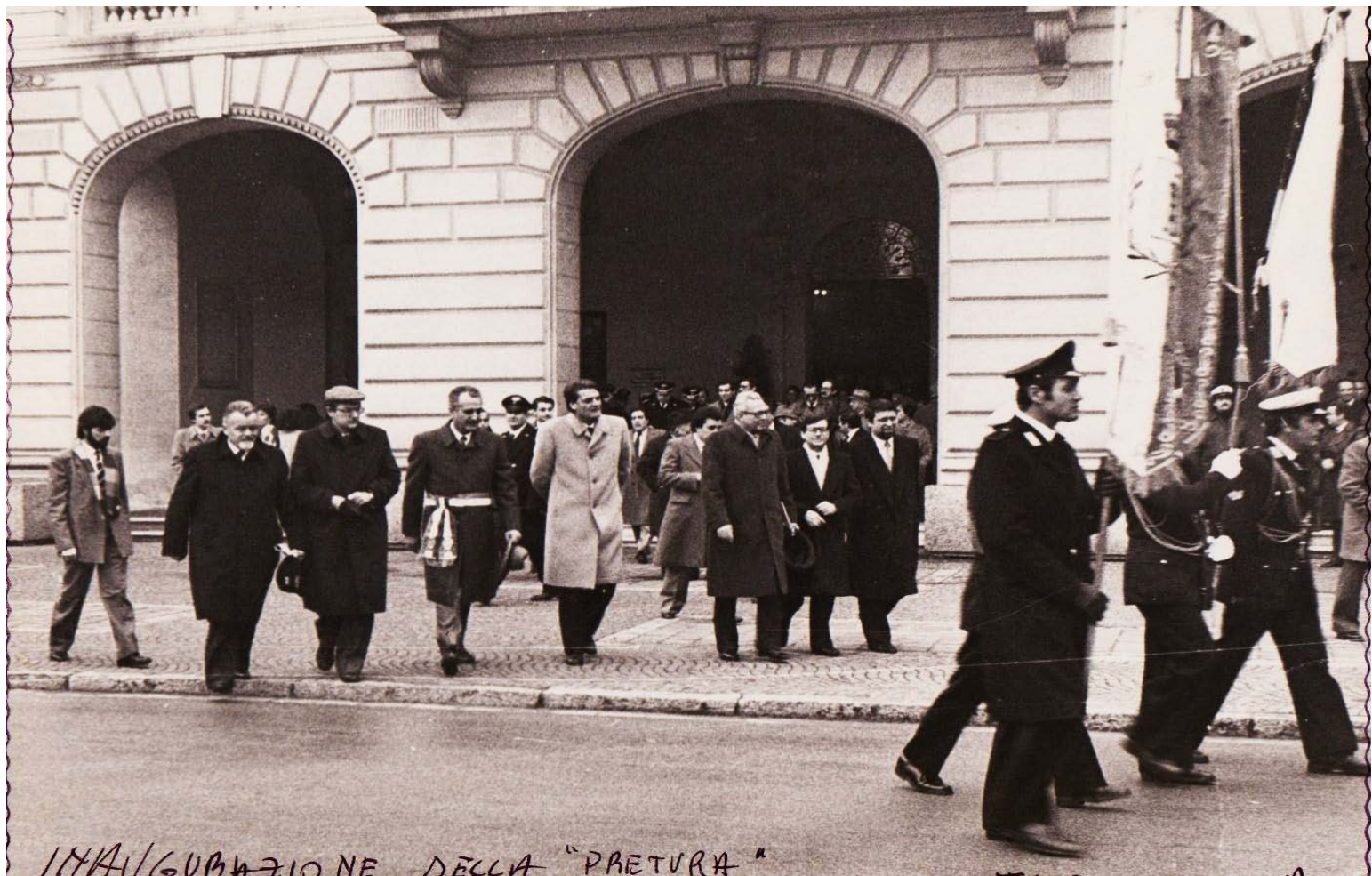
FOTO A MESTRE IN CORTEO USCITI DAL MUNICIPIO CON IN TESTA IL GONFALONE DELLA CITTA SI RECANO IN VIALE LIBERTA' PER INAUGURARE LA NUOVA PRETURA E TAGLIARE IL NASTRO TRICOLORE ALL'ENTRATA IL 28 GENNAIO 1984