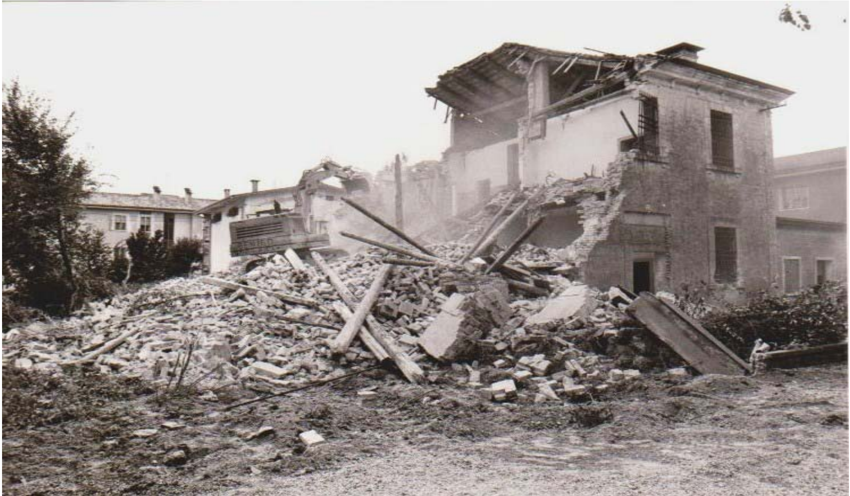
ARCHIVIO DEL CLUB 54 FOTO DI A MESTRE UNA RUSPA STA' COMPLETANDO LA DEMOLIZIONE DEL CARCERE MNDAMENTALE