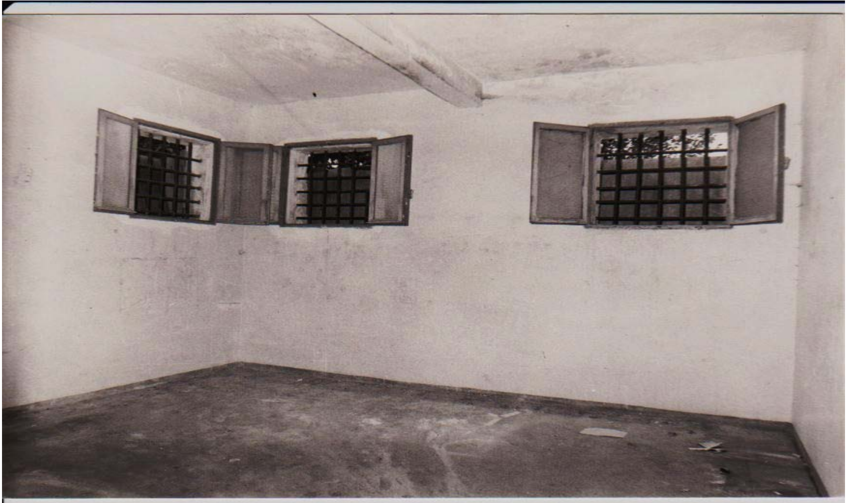
UNA CELLA ALL'INTERNO DELLE CARCERI MANDAMENTALI DI SANDONA'DI PIAVE