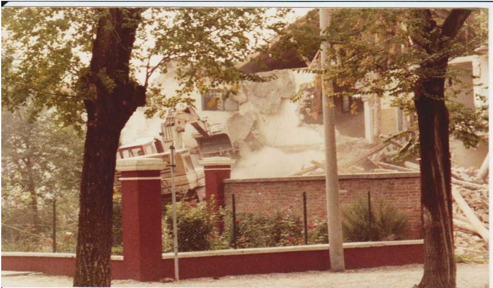
UNA RUSPA IN PIENA AZIONE AGGREDISCE LE OPERE IN MURATURA DELLE CARCERI MANDAMENTALI