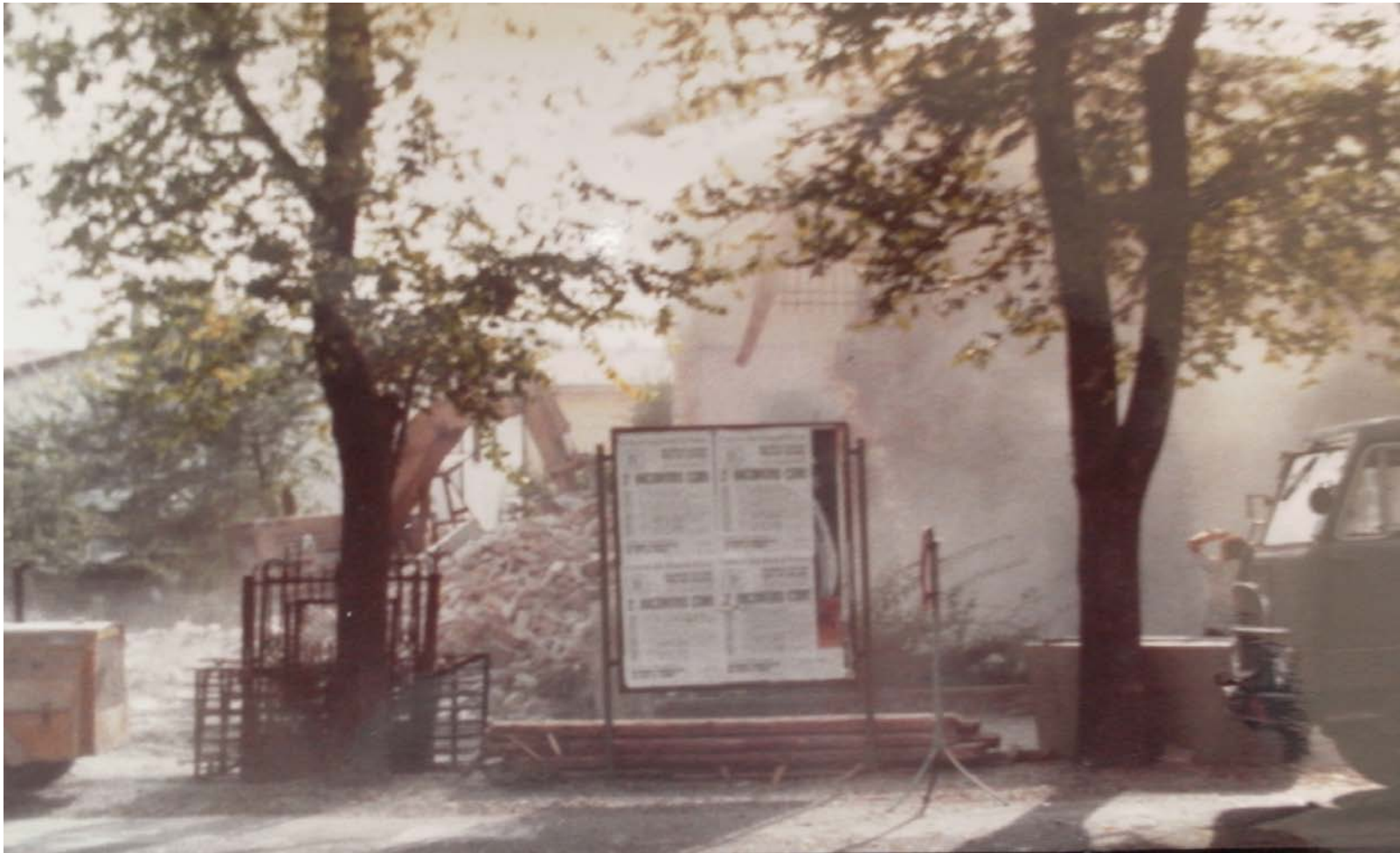
ARCHIVIO FOTOGRAFICO DEL CLUB 54 LE POLVERI DELLA DEMOLIZIONE