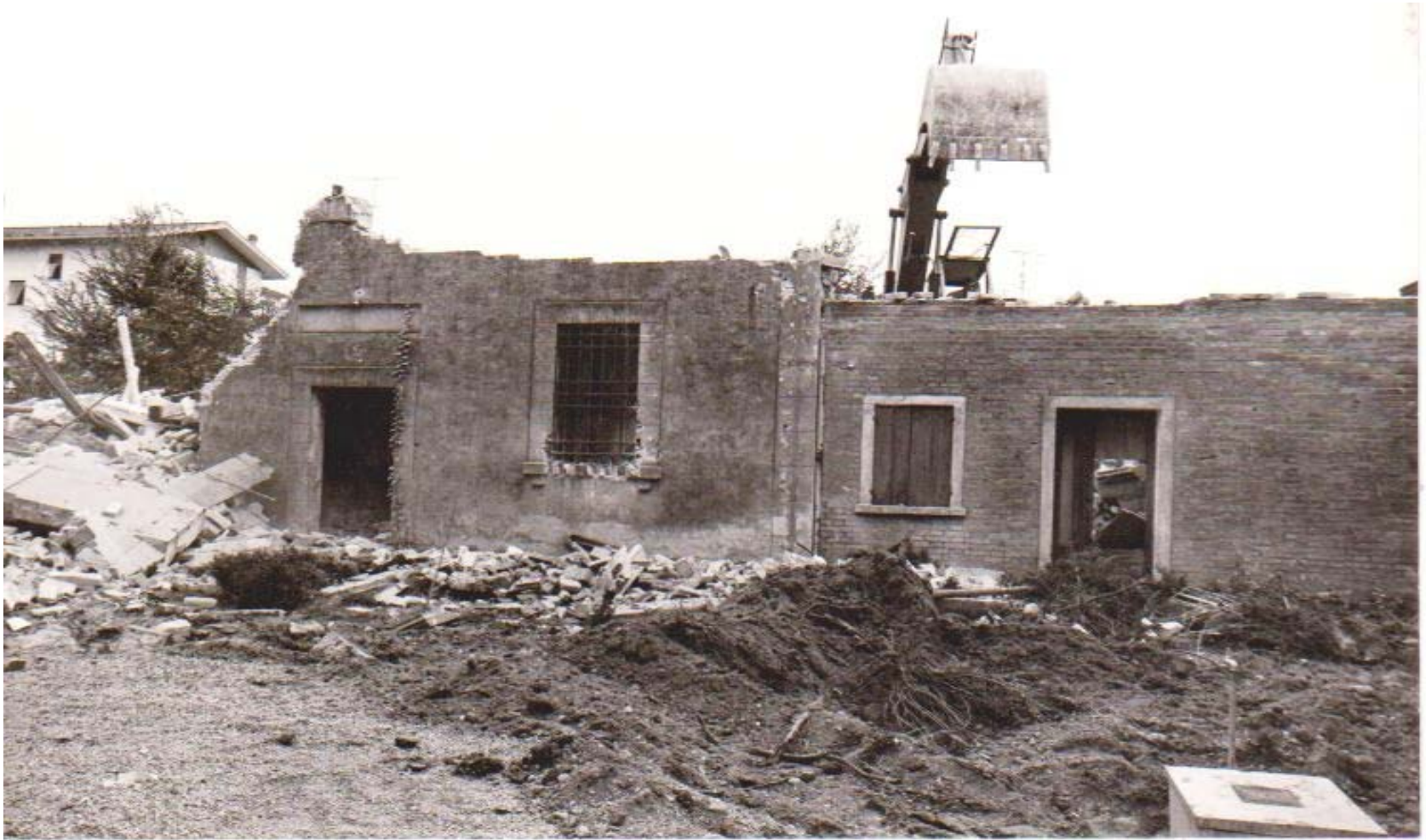
DEMOLIZIONE DEL CARCERE MANDAMENTALE