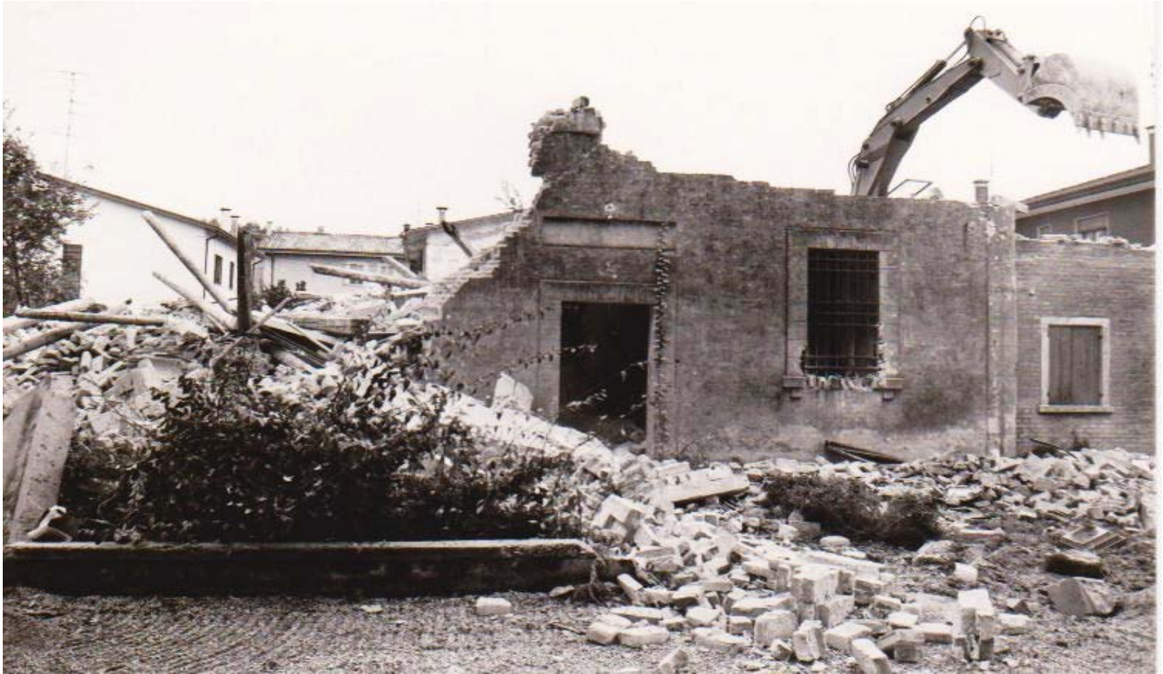
DEMOLIZIONE QUASI ULTIMATA DELLE CARCERI MANDAMENTALI