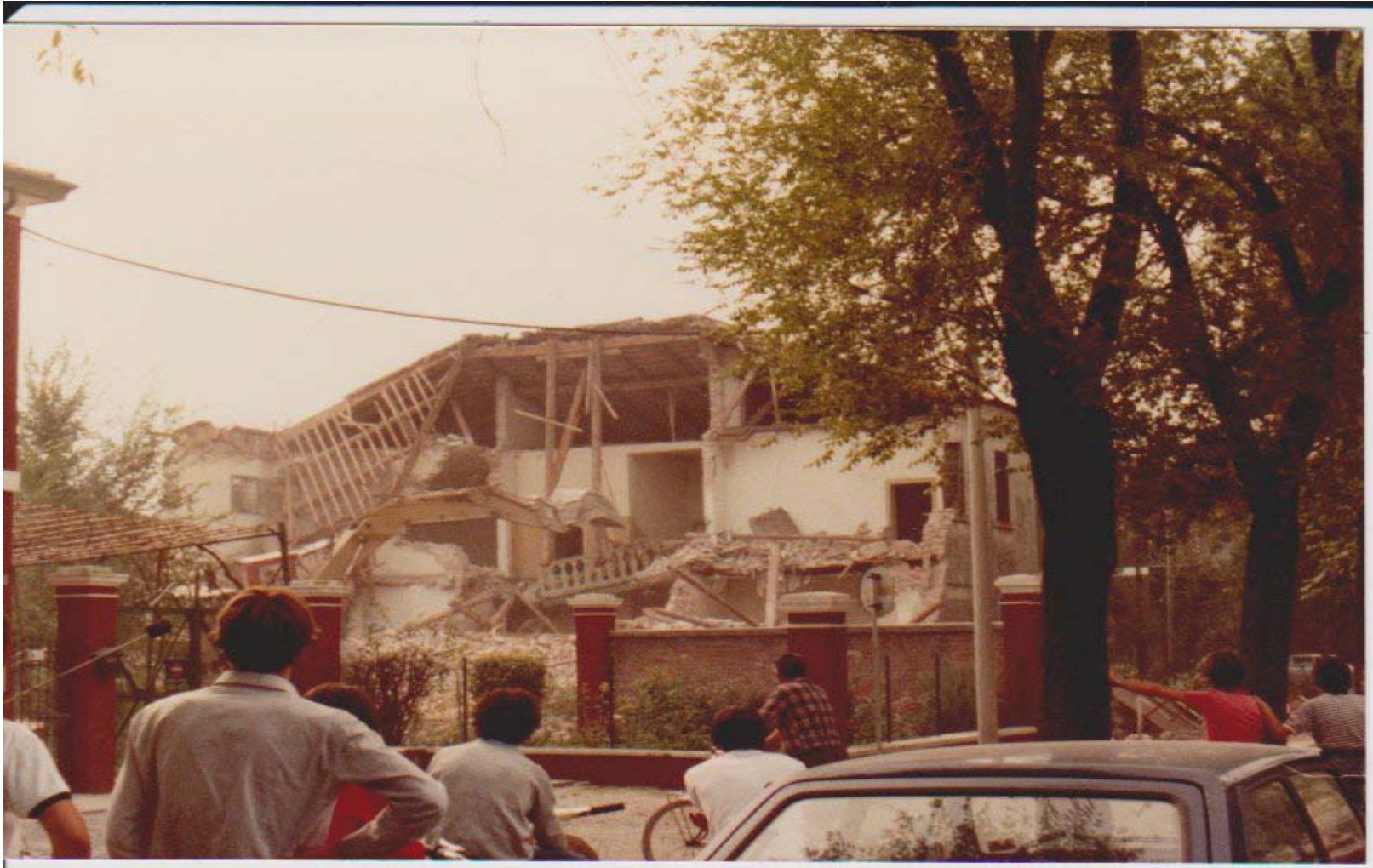
ARCHIVIO FOTOGRAFICO DEL CLUB 54 SANDONATESI CHE ASSISTONO ALLA DEMOLIZIONE DELLE CARCERI MANDAMENTALI