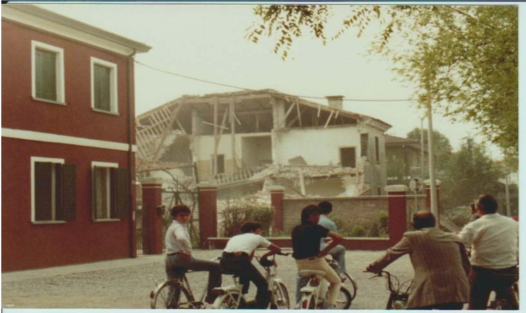
ARCHIVIO FOTOGRAFICO CLUB 54 CURIOSI ASSISTONO ALLA DEMOLIZIONE DEL CARCERE MANDAMENTALE