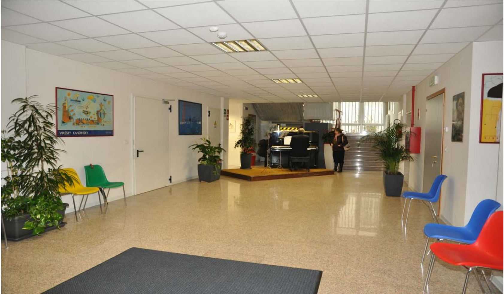
CLUB 54 L'AMPIO SALONE ALL'ENTRATA DEL NUOVO LICEO SAN LUIGI