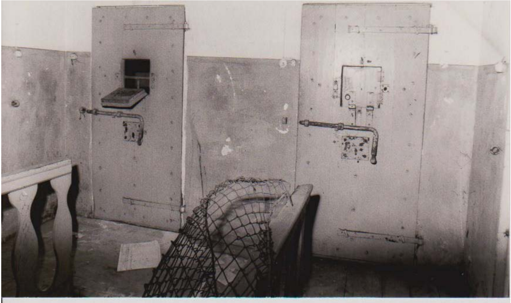
ARCHIVIO FOTOGRAFICO CLUB 54 FOTO DI A MESTRE LE CELLE AL PRIMO PIANO DEL CARCERE MANDAMENTALE DI SAN DONA' DI PIAVE