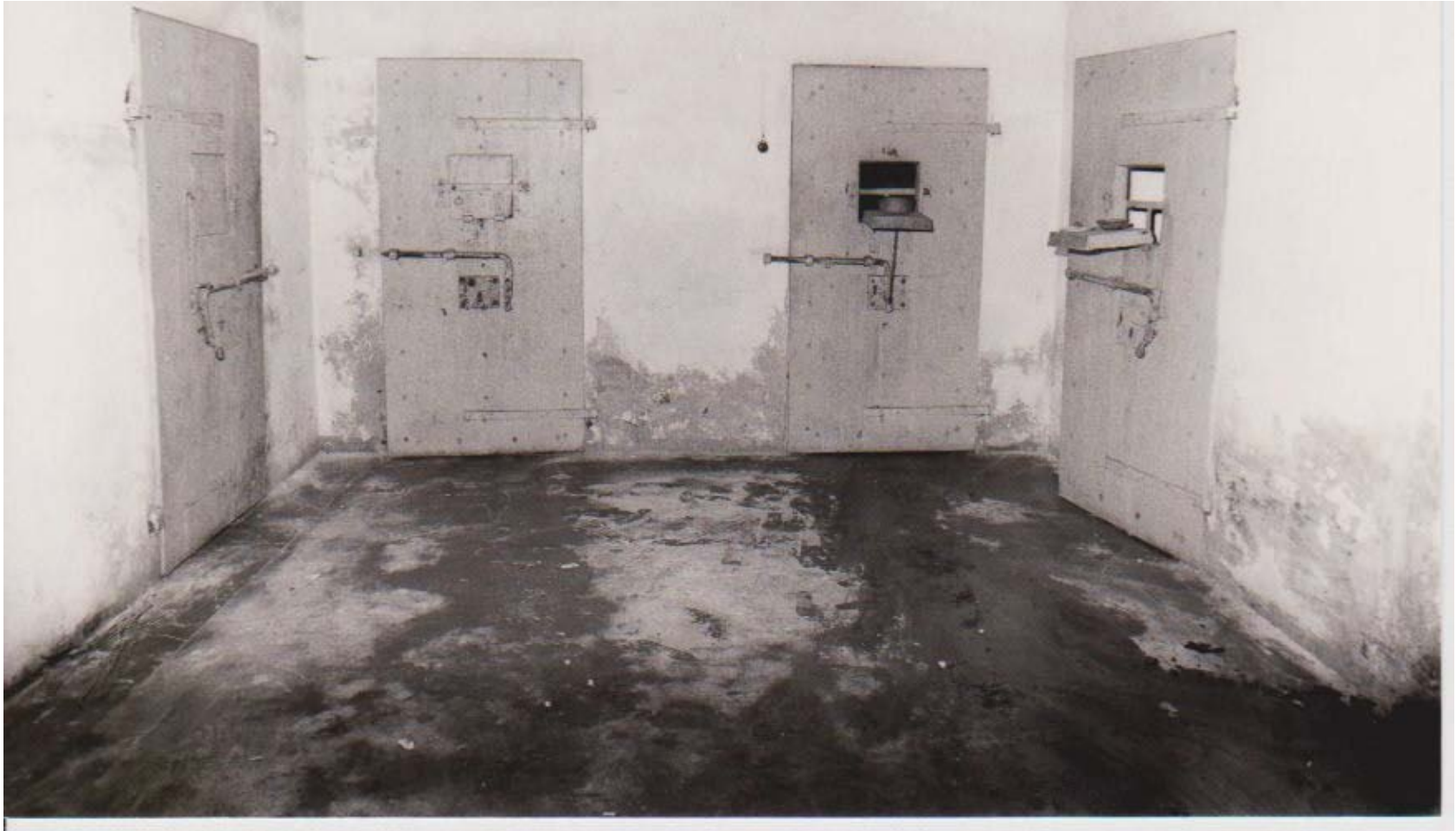
CELLE AL PIANTERRENO DEL CARCERE MANDAMENTALE