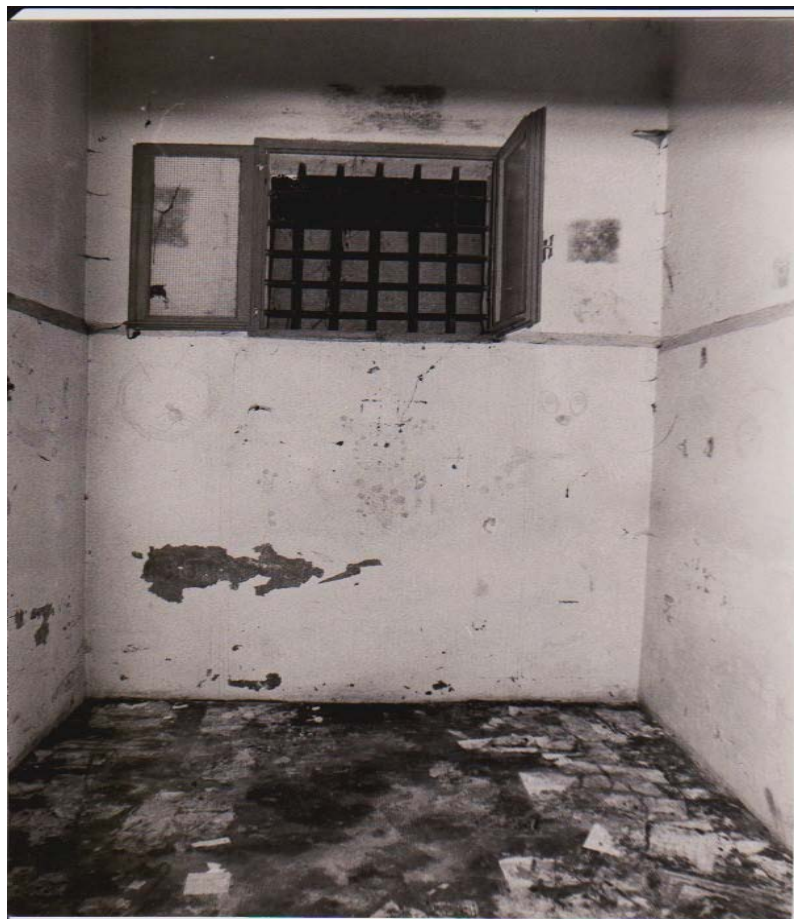
PARTICOLARE DI UNA CELLA DEL CARCERE MANDAMENTALE DI SAN DONA' DI PIAVE