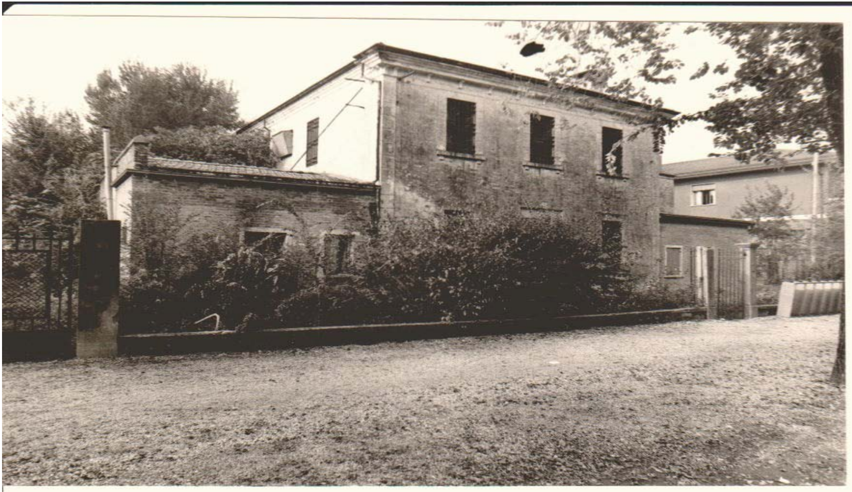
LE CARCERI MANDAMENTALI IN VIALE LIBERTA' DEMOLITE IL 23 SETTEMBRE 1981