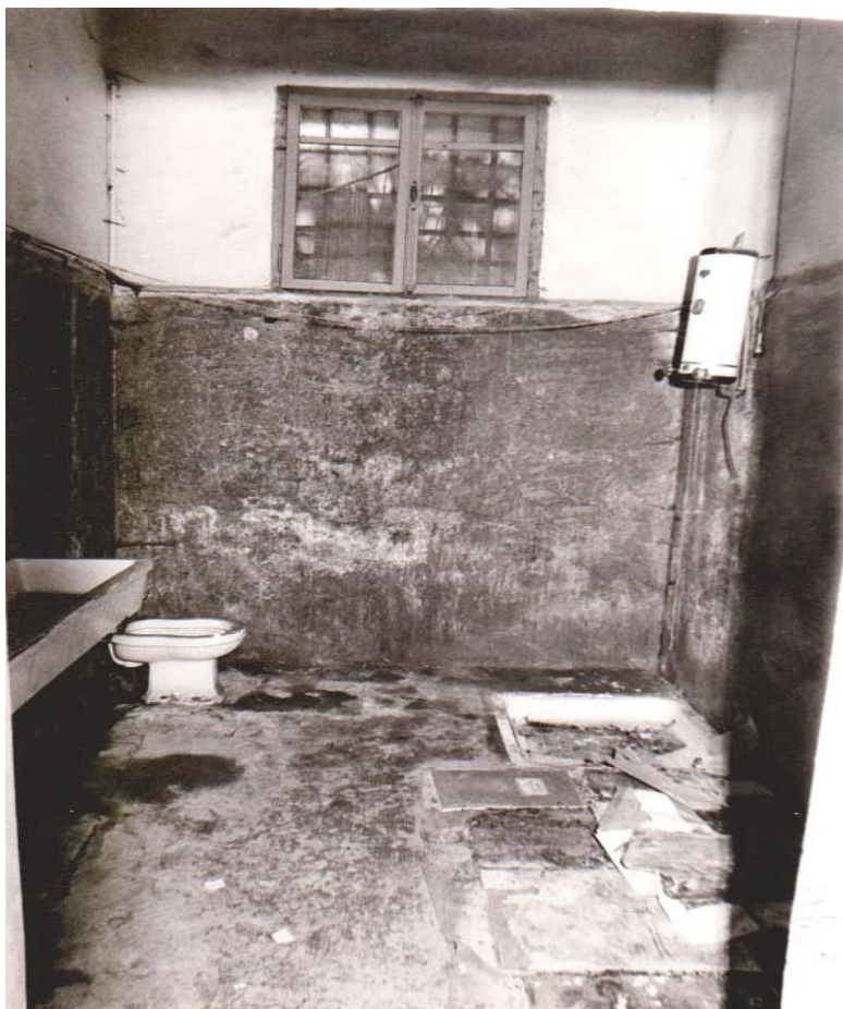
PARICOLARE DI UNA CELLACOMPLETA DI SERVIZI IGIENICI COMPRESA L'ACQUA CALDA