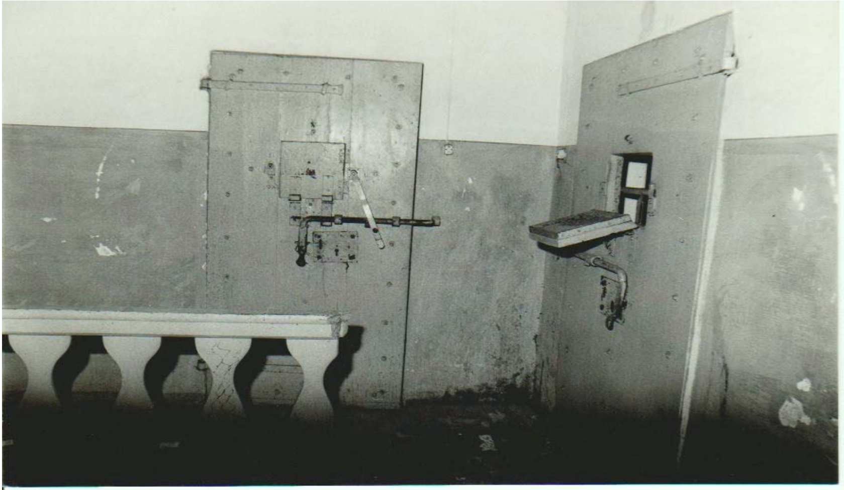
PARTICOLARI DELLE PORTE DELLE CELLE DEL CARCERE MANDAMENTALE