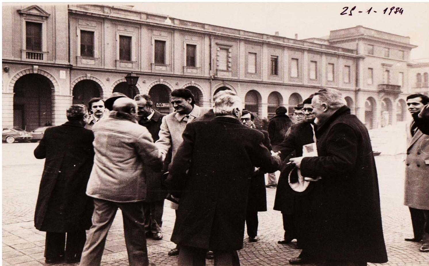
ATTESA DI FRONTE AL MUNICIPIO PER ANDARE AD INAUGURARE IL NUOVO PALAZZO DELLA PRETURA IN VIALE LIBERTA' A SAN DONA' DI PIAVE, AL CENTRO IL MINISTRO MINO MARTINAZZOLI A DESTRA IN PRIMO PIANO IL SINDACO DI SAN DONA' DI PIAVE