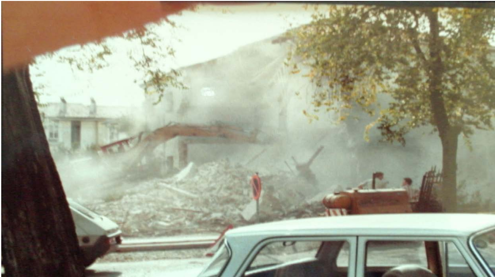
LA POLVERE DELLA DEMOLIZIONE